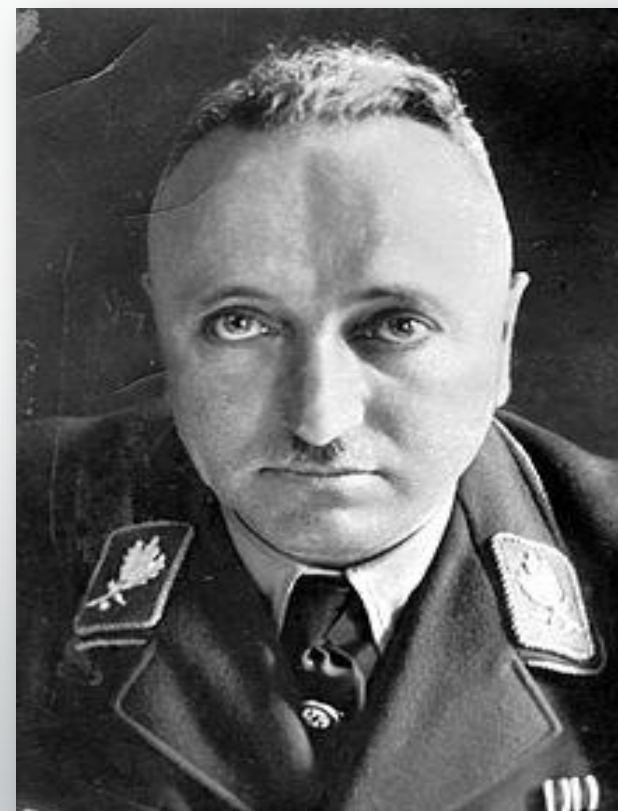
Ұйымның жетекшісі – Роберт Лей.