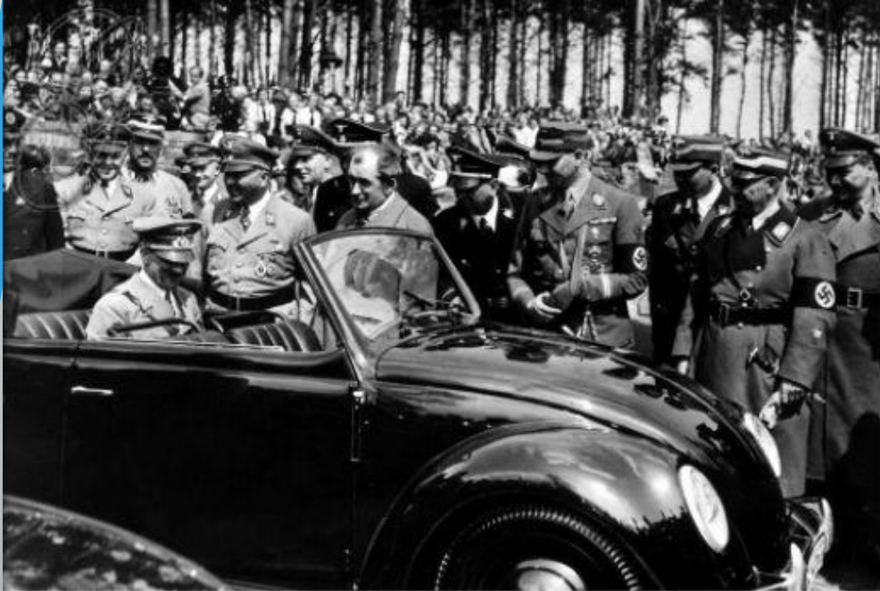
0072868 VOLKSWAGEN FACTORY, 1938.

Герман жұмыс фронты бірқатар кәсіпорындардың ашылуына негіз болды, соның ішінде герман еңбек банкі және «Фольксваген» атты алғашқы машина жасау заводы.