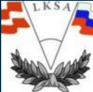
Латвийско-Российская Ассоциация сотрудничества