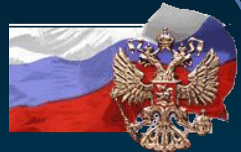
Посольство РФ в Латвии