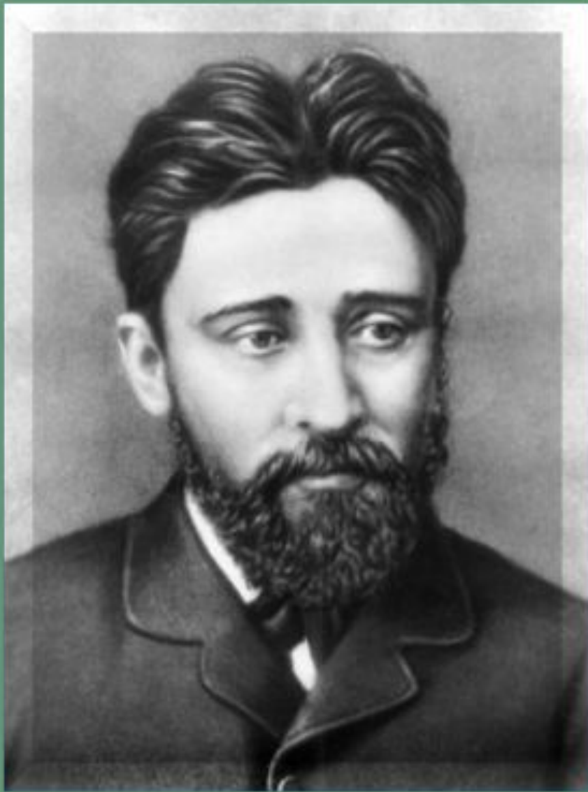
Всеволод Михайлович Гаршин (1855-1888)