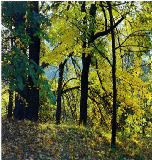
Смешанные и широколиственные леса летом