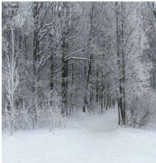
Смешанные и широколиственные леса зимой