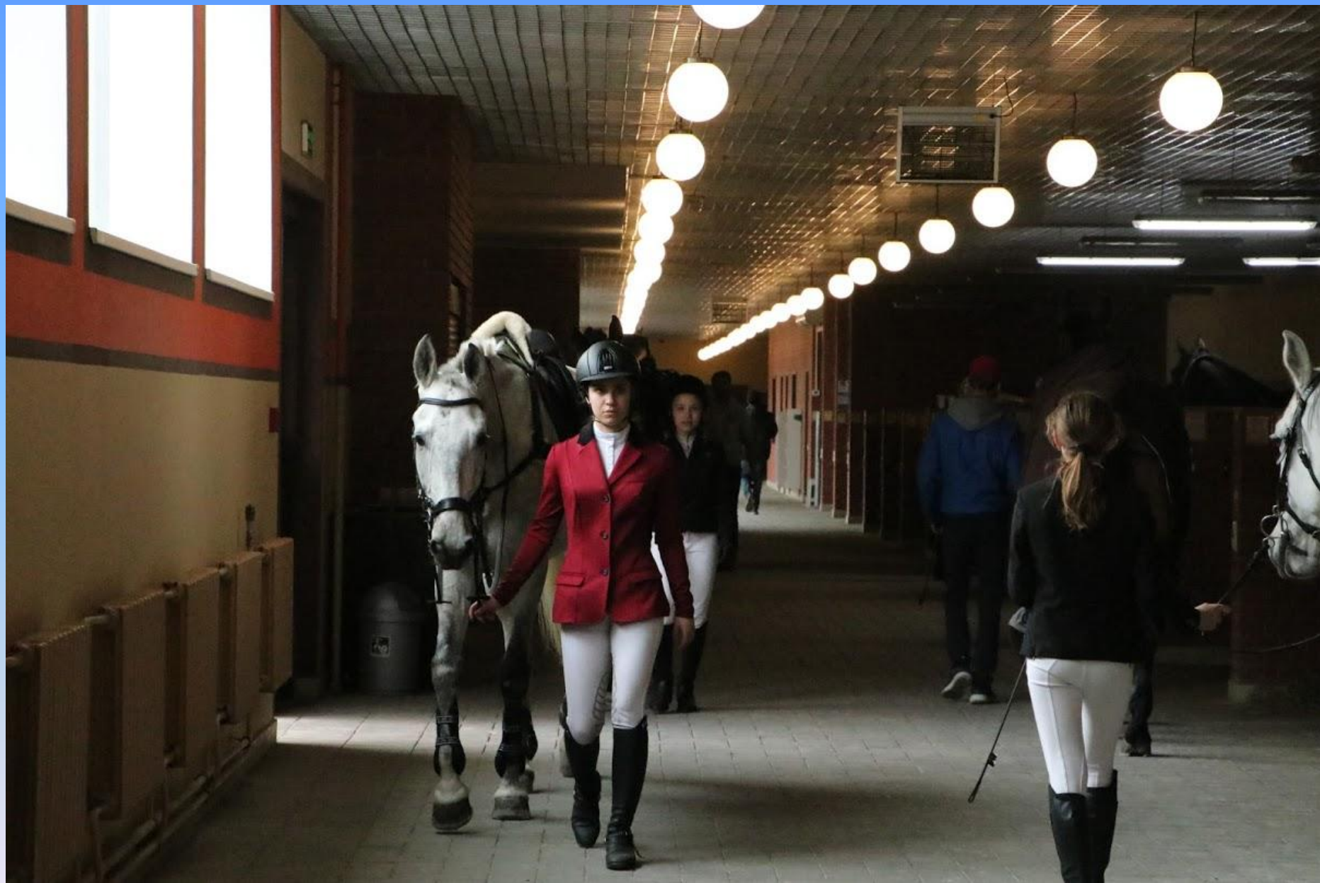
Конно – спортивный клуб «Дивный», на территории которого расположен военный музей