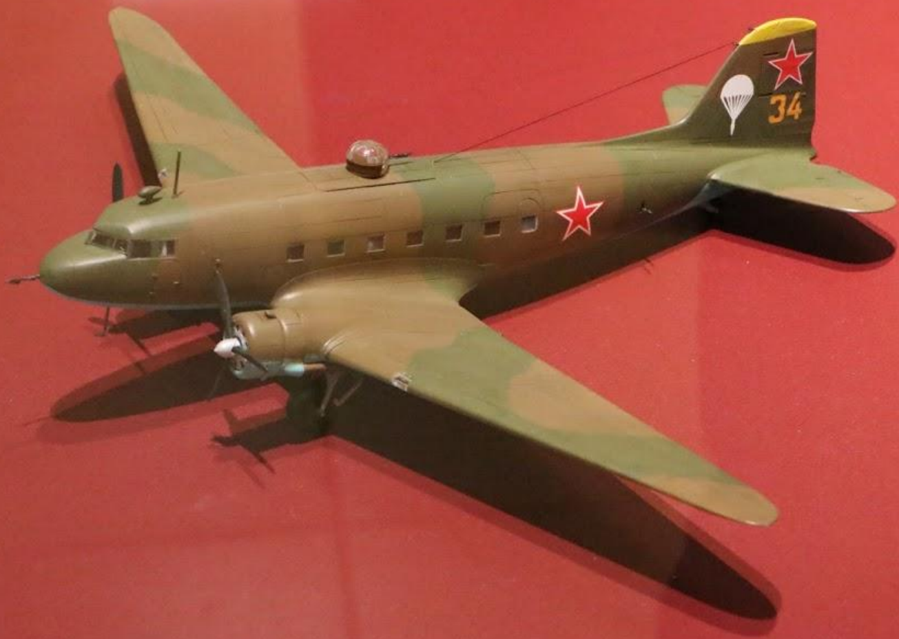
PHOTO REPRODUCTION CAMOUFLET MK-2 1940-1945 67mm 4007 in 172-100