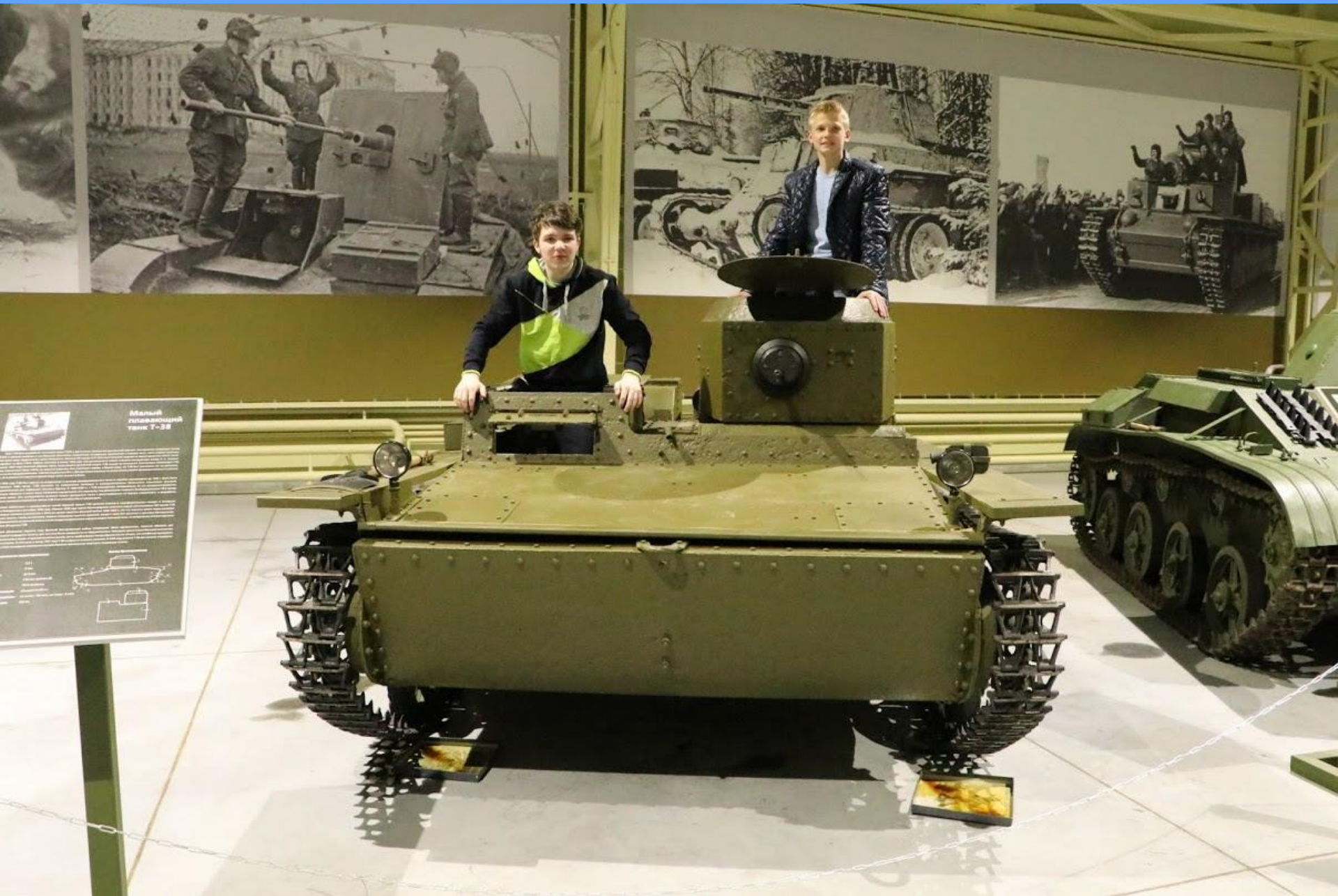
Малый гусеничный танк Т-38