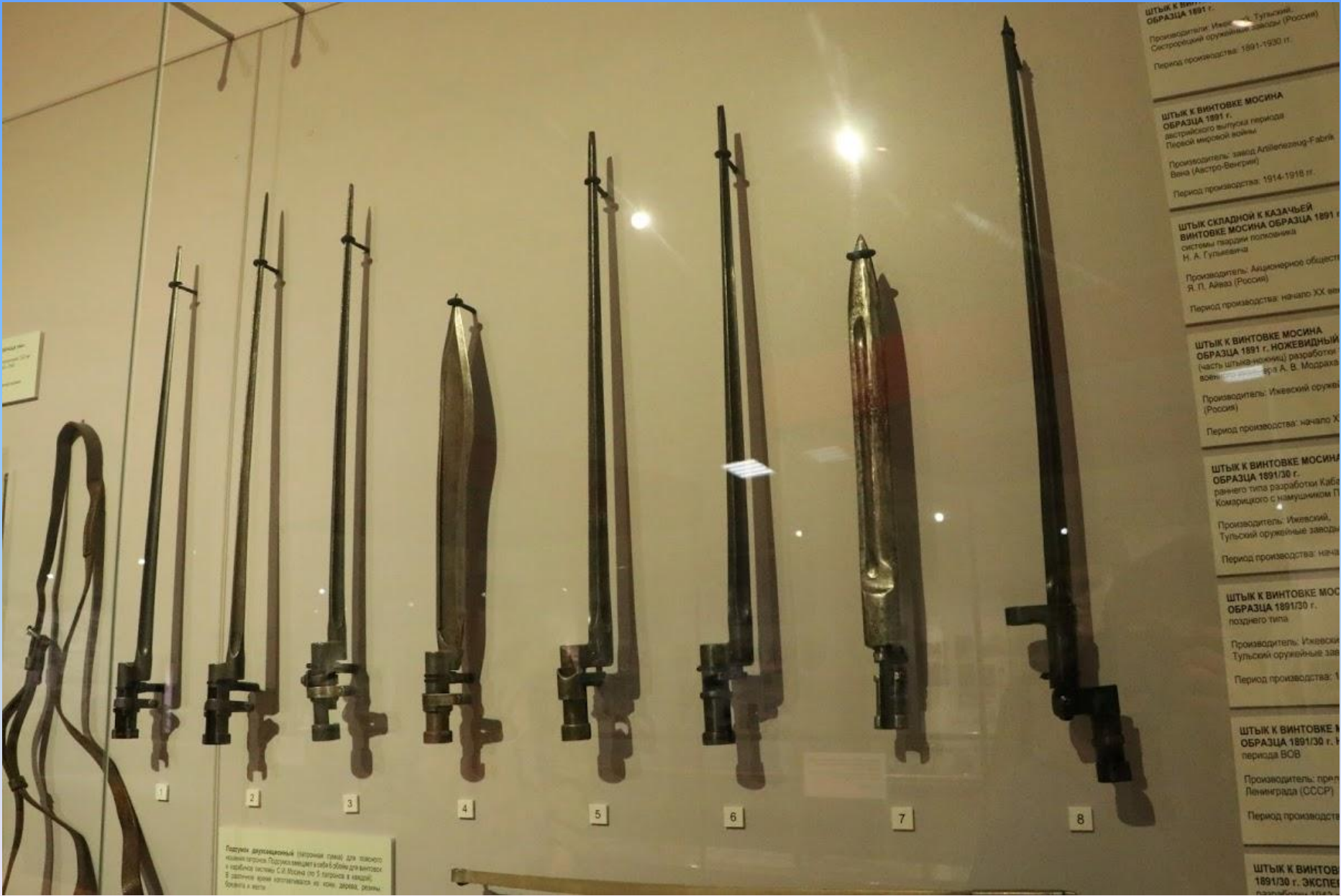
ШТЫК К ВИНТОВКЕ МОСНИНА ОБРАЗА 1891 г. Производитель: Ижевский, Тульский, Сестротский оружейные заводы (Россия) Период производства: 1891-1930 гг.