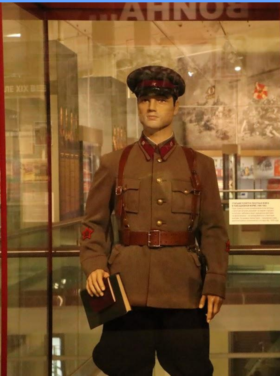
СТАРИНА ТИПОЛНА ПЕШТЕРНА ВОЈНА И ПОДСЕДНАКА КОРИС (1941-1945) Овај тип униформа била је стандардна за Совјетски војници током Другог светског ратног периода. Униформа је била направљена од тешких материјала како би могла да издржи тежак рад и временске услове. Иако је изгледала масивно, униформа је била практична и удобна.