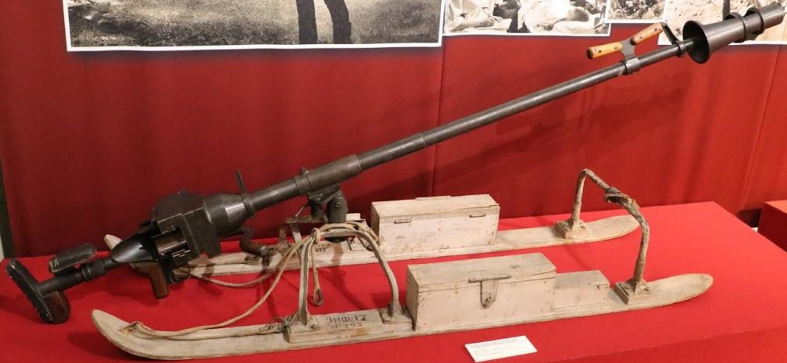
110-12 N 283