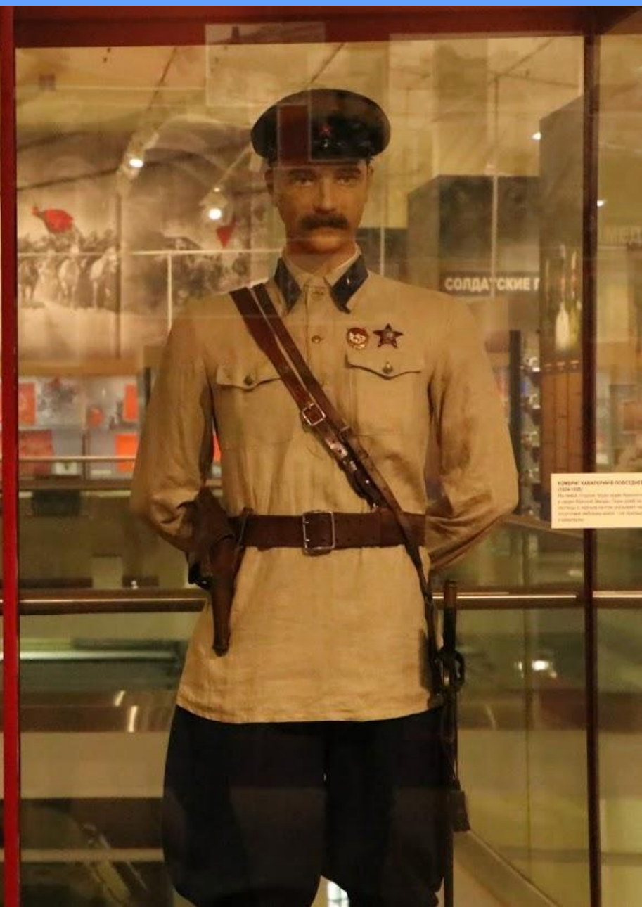
КОРИС КАВАЛЕРИЈЕ ПЕШТЕРНА ВОЈНА (1941-1945) Ова униформа била је стандардна за Совјетски војници током Другог светског ратног периода. Униформа је била направљена од тешких материјала како би могла да издржи тежак рад и временске услове. Иако је изгледала масивно, униформа је била практична и удобна.