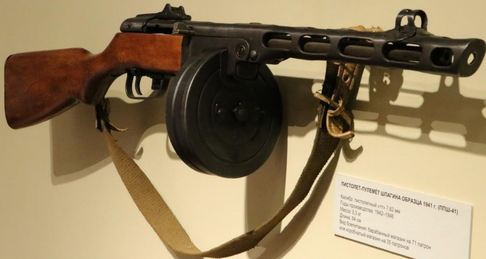
ПИСТОЛЕТ-ПУЛЕМЁТ ШПАГИНА ОБРАЗЦА 1941 г. (ППШ-41)