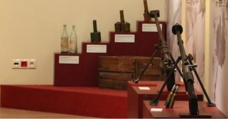
Small white informational label on the red display stand.