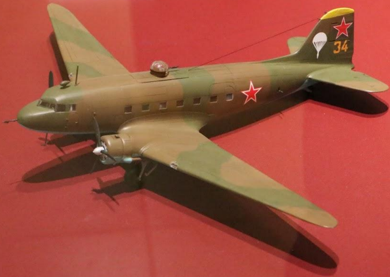
PHOTO REPRODUCTION CAMOUFLET MK-2 1942-1945 67mm 4000 in 175mm