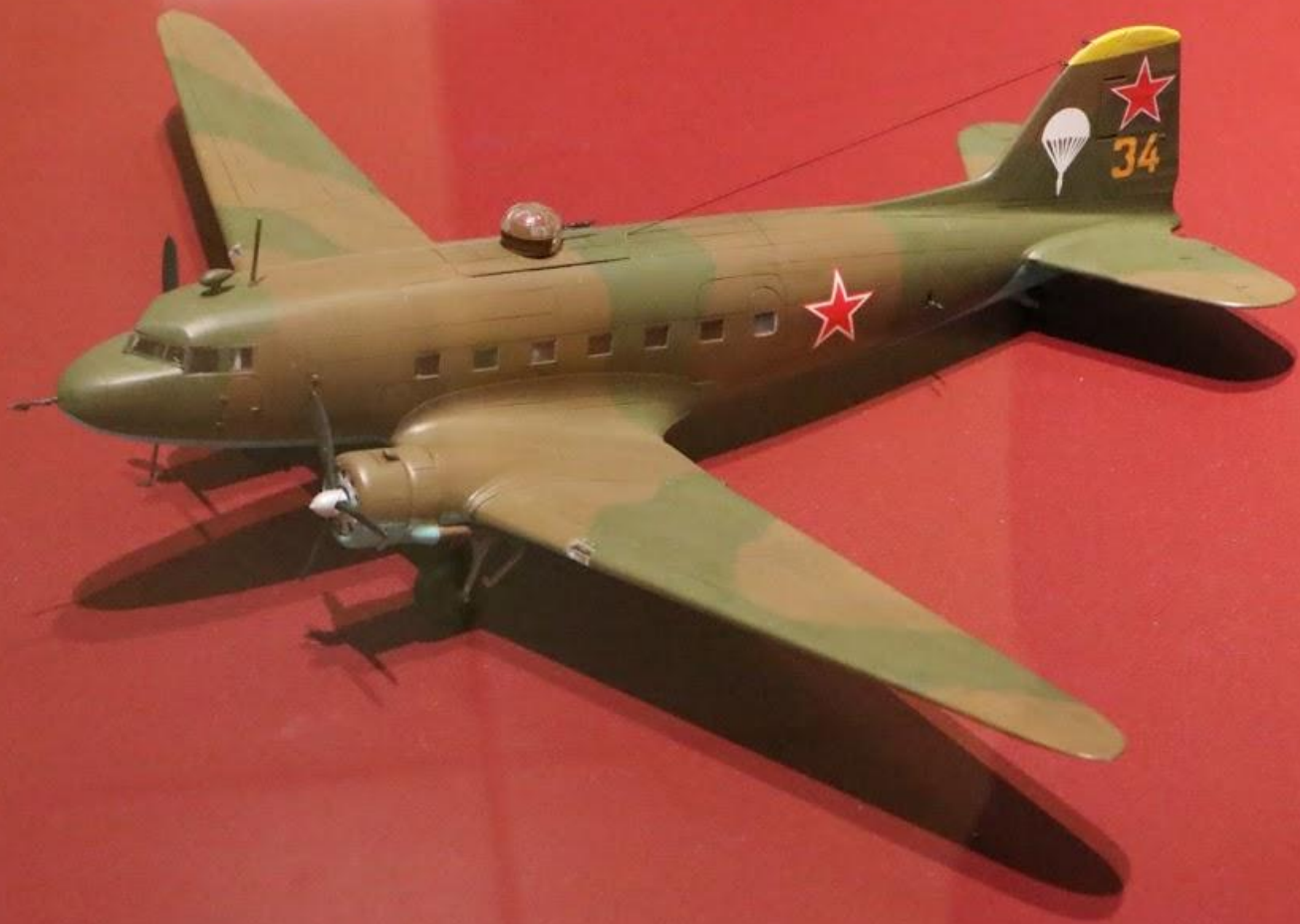
PHOTO REPRODUCTION CAMOUFLET MK-2 1942-1945 67mm 4000 in 172-100