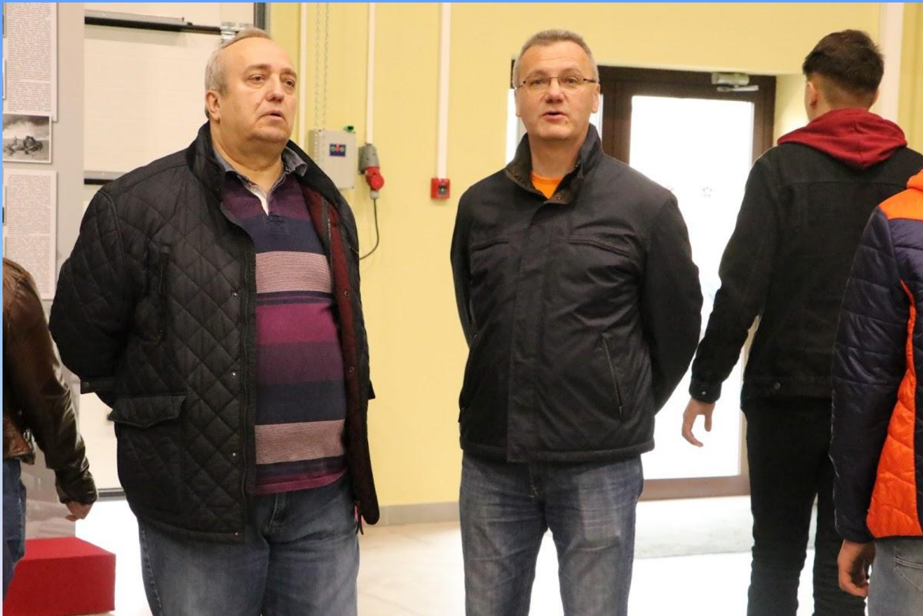
Сенатор Ф.А. Клинецвич и владелец музея