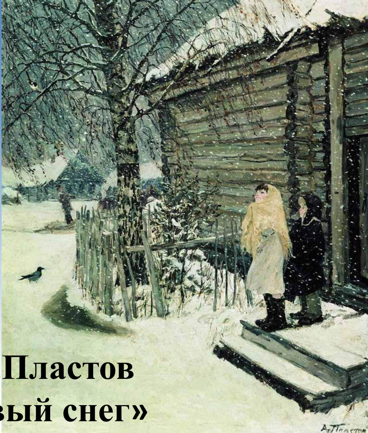
А.А.Пластов «Первый снег»