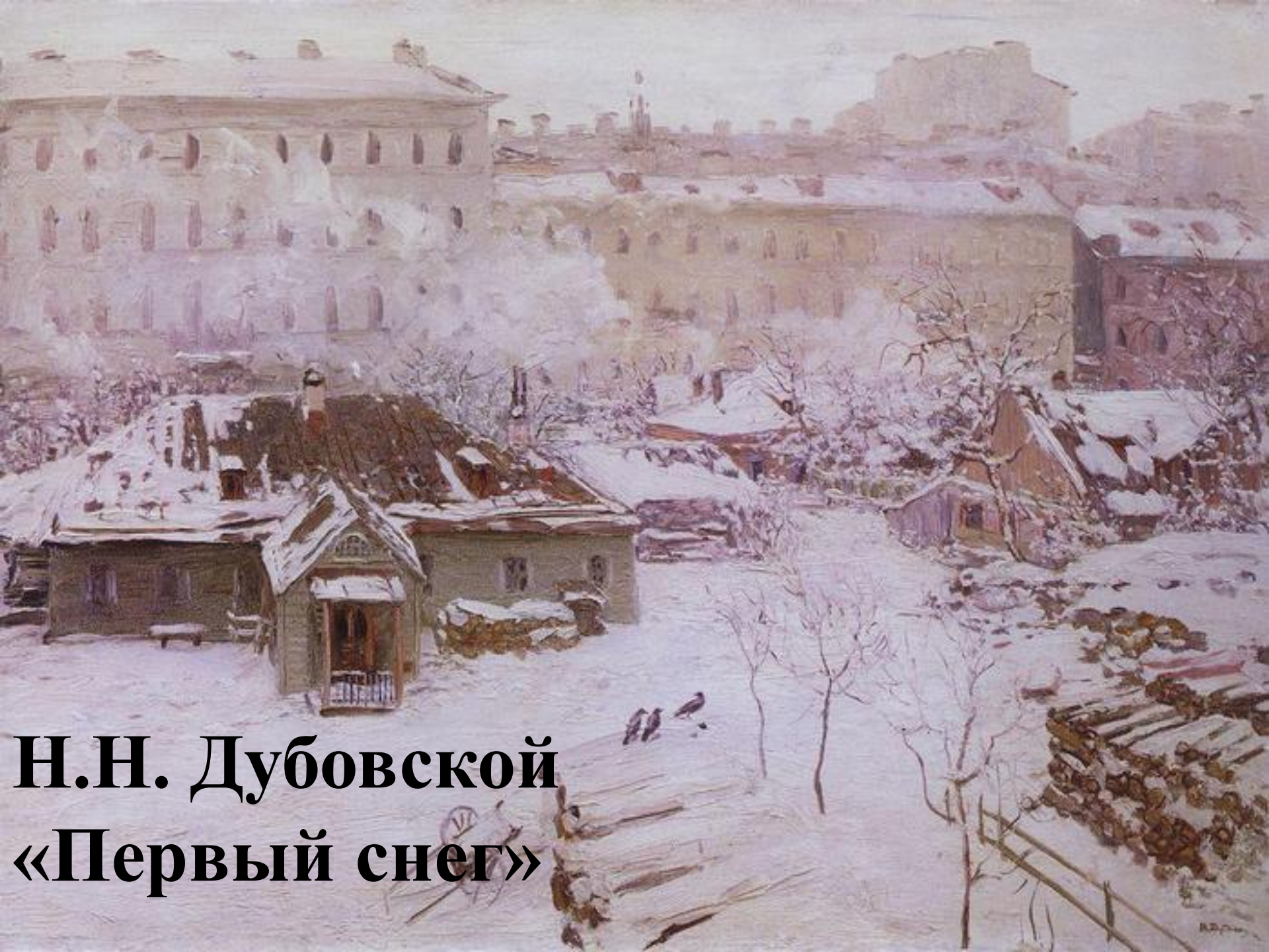
Н.Н. Дубовской «Первый снег»