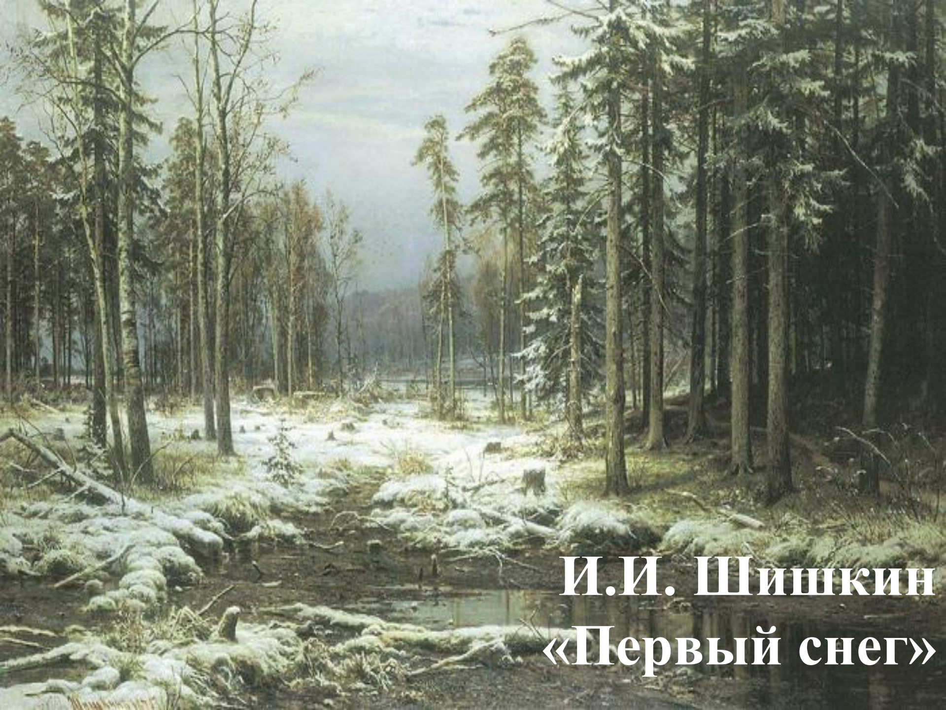
И.И. Шишкин «Первый снег»