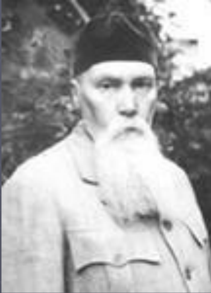
Николай Константинович Рерих 1874 - 1947