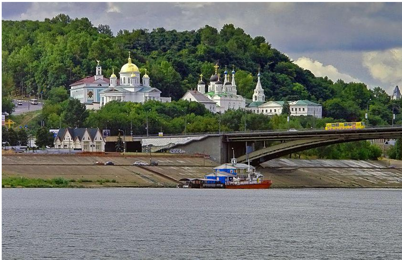
▣ Вид на монастырь с Канавинского моста через Оку.

Сегодня мы продолжим говорить о русском зодчестве. Я вас приглашаю совершить виртуальное путешествие в самый центр России – Нижегородскую область.