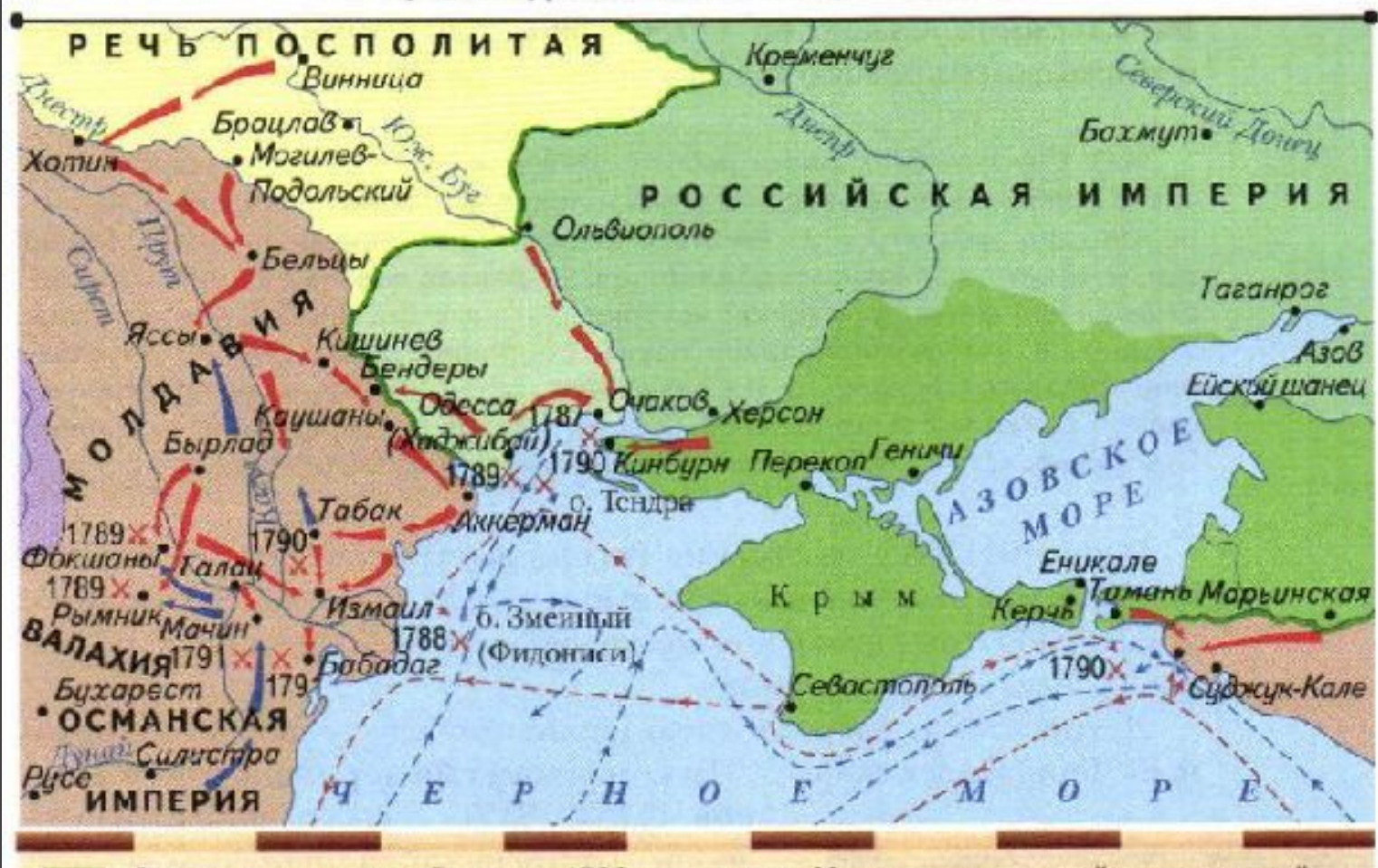
Русско-турецкая война 1787—1791 гг.