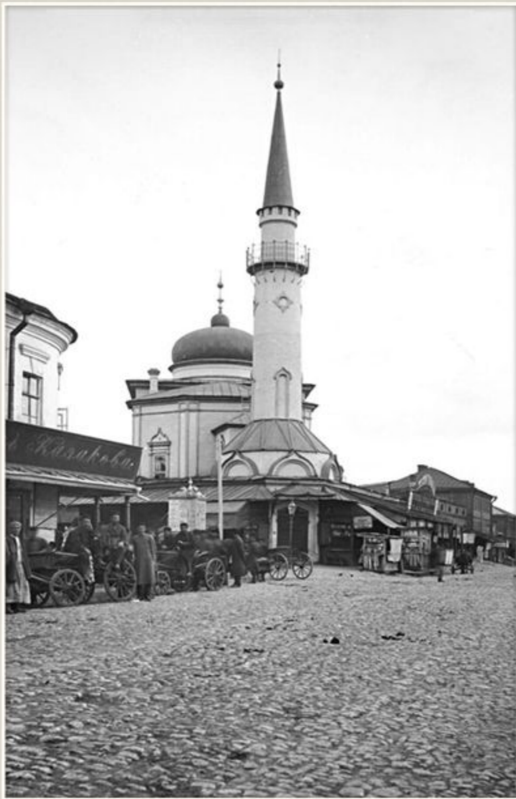
Сенная мечеть в XIX веке