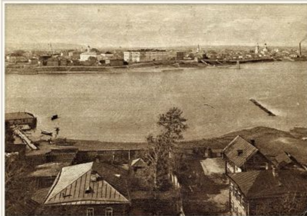
Вид на озеро Кабан и Старо-Татарскую слободу (1920-е — 1930-е годы)