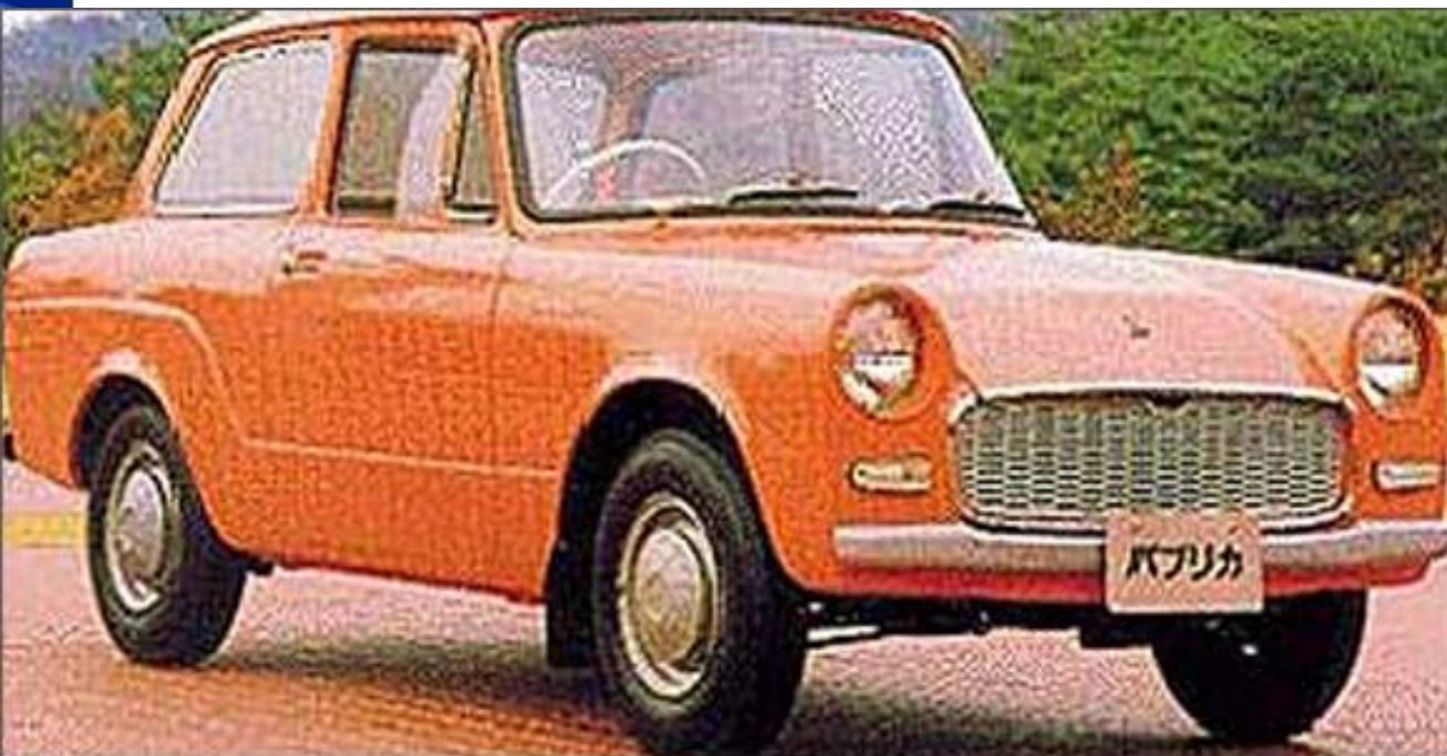
В 1961 году выпущена модель Toyota Publica