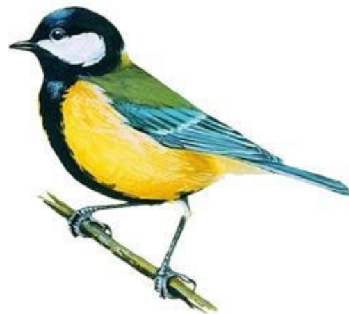
птичка (какая?) маленькая