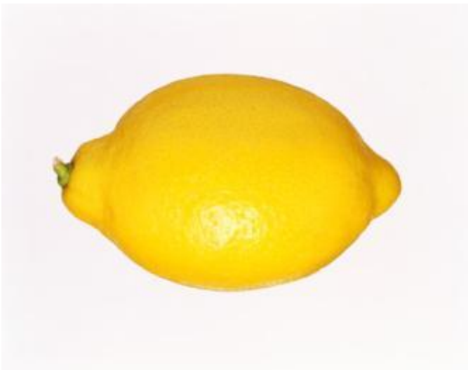
лимон (какой?) кислый