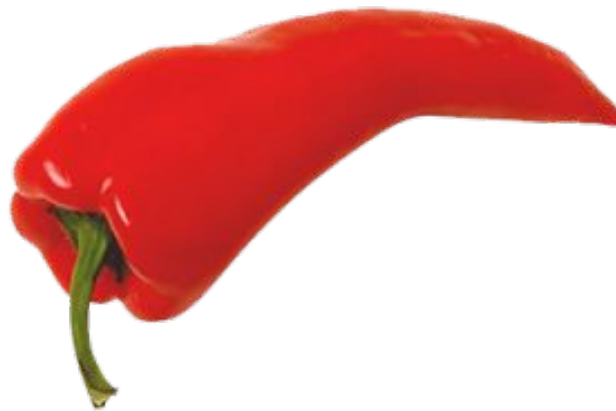
перец (какой?) горький