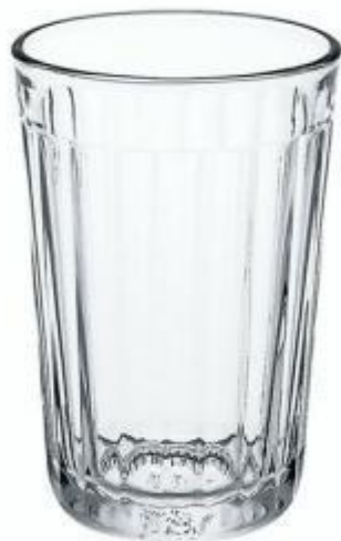
стакан (какой?) стеклянный