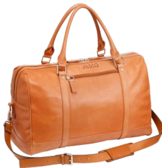
сумка (какая?) кожаная