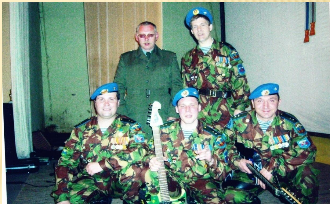
Голубые молнии. 9-я Гвардейская дивизия г. Луга

Орден Красной Звезды вручён герою через 17 лет после службы в Афганистане