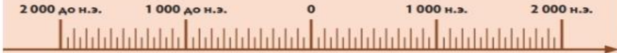
Рис. 2. Лента времени

Историк Арриан, живший в 90–175 гг. н. э., в своем труде «Поход Александра» писал: «Саки не уходили с побережья Сырдарьи. Саки обстреливали греков из луков с другого берега реки». Отметьте на ленте времени годы жизни Арриана и годы походов Александра Македонского на восточные страны. Определите, сколько лет прошло между этими событиями. Как вы думаете, являются ли сведения Арриана о походах Александра Македонского достоверными?