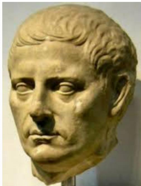
Курций Руф Квинт III