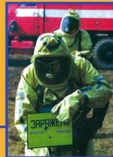
Выбор и соблюдение режимов защиты людей в условиях радиоактивного и химического заражения