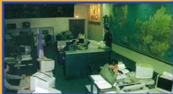
Сбор, обработка данных и информации о радиационной и химической обстановке в зонах заражения (загрязнения)