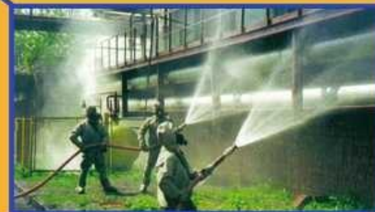
Специальная обработка и обеззараживание участков местности, дорог, объектов, зданий и сооружений