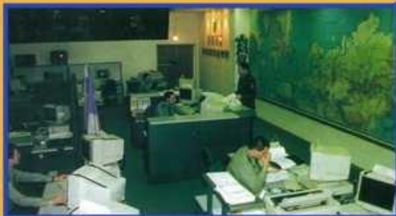
Сбор, обработка данных и информации о радиационной и химической обстановке в зонах заражения (загрязнения)