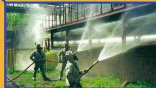
Специальная обработка и обеззараживание участков местности, дорог, объектов, зданий и сооружений