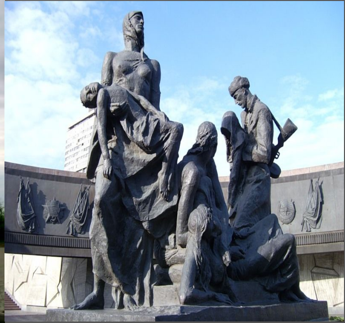
Памятник героическим защитникам блокадного Ленинграда