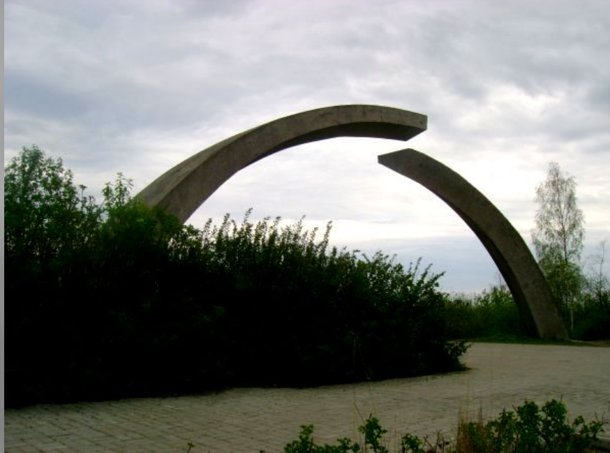
Памятник в честь разрыва блокады Ленинграда

Приказом Верховного Главнокомандующего от 1 мая 1945 года Ленинград вместе с Москвой, Сталинградом, Севастополем и Одессой был назван городом-героем за героизм и мужество, проявленные жителями города во время блокады... 8 мая 1965 года Указом Президиума Верховного Совета СССР Город-герой Ленинград был награждён орденом Ленина и медалью «Золотая Звезда».