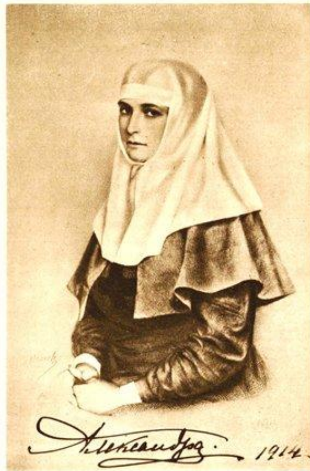
Августійшан Сестра милосердія Государыня Императрица Александра Феодоровна.