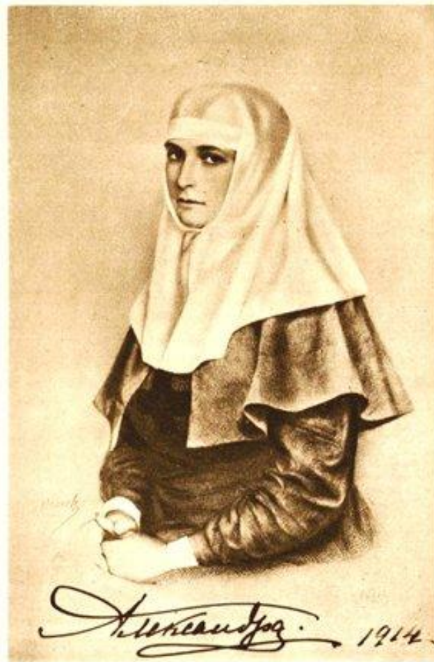
Августійшан Сестра милосердія Государыня Императрица Александра Феодоровна.