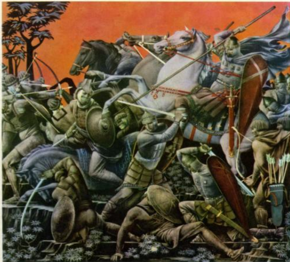
С. КОБУЛАДЗЕ (р. 1909). Иллюстрация к «Слову о полку Игореве». Битва с половцами. 1909. Бумага, гуашь. 45 x 45. Музей искусств Грузинской ССР. Тбилиси.