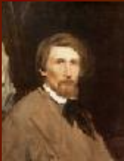
Автопортре т. Васнецов