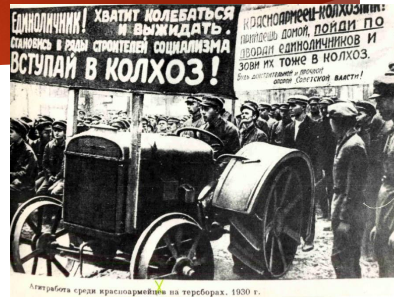
Агитработа среди красноармейцев на терсборах. 1930 г.