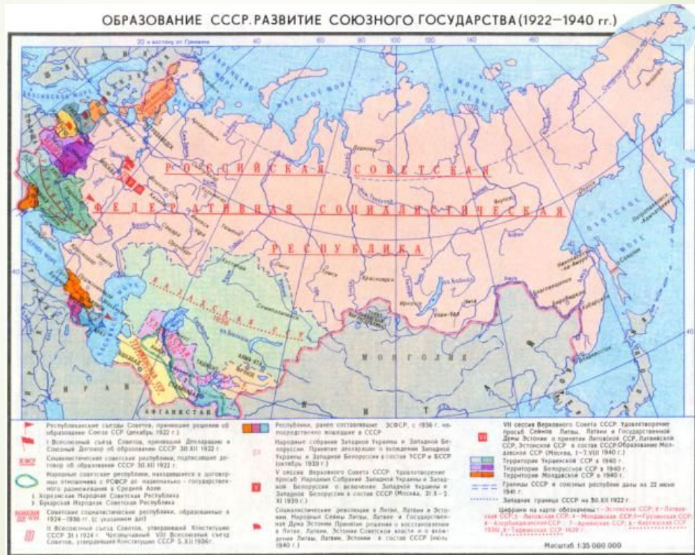
ОБРАЗОВАНИЕ СССР. РАЗВИТИЕ СОЮЗНОГО ГОСУДАРСТВА (1922—1940 гг.)