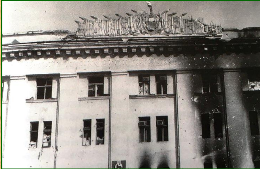
Здание Совета министров в Грозном, 1995 год.