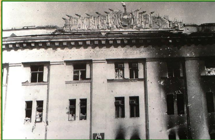
Здание Совета министров в Грозном, 1995 год.