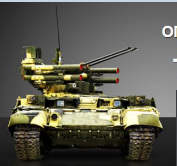
БОЕВАЯ МАШИНА ОГНЕВОЙ ПОДДЕРЖКИ БОЕВАЯ МАШИНА ОГНЕВОЙ ПОДДЕРЖКИ ТЕРМИНАТОР