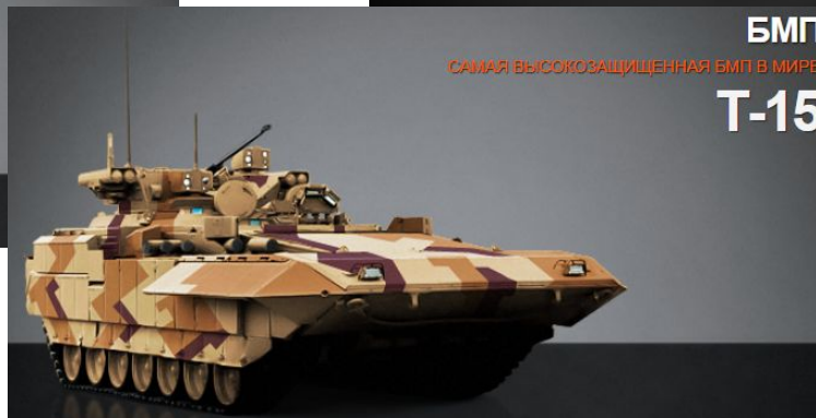
БМП САМАЯ ВЫСОКОЗАЩИЩЕННАЯ БМП В МИРЕ T-15