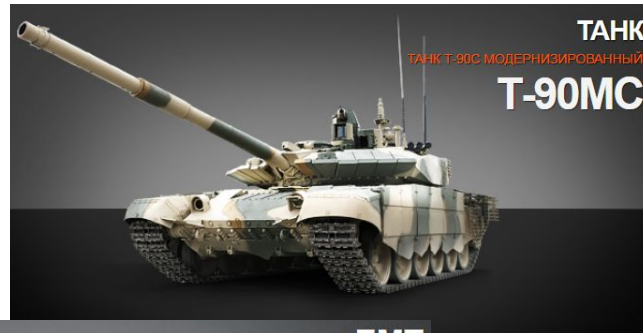
ТАНК ТАНК Т-90С МОДЕРНИЗИРОВАННЫЙ T-90МС