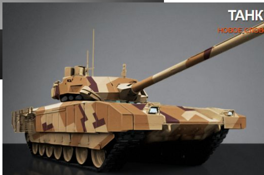
ТАНК «АРМАТА» НОВОЕ СЛОВО В ТАНКОСТРОЕНИИ T-14