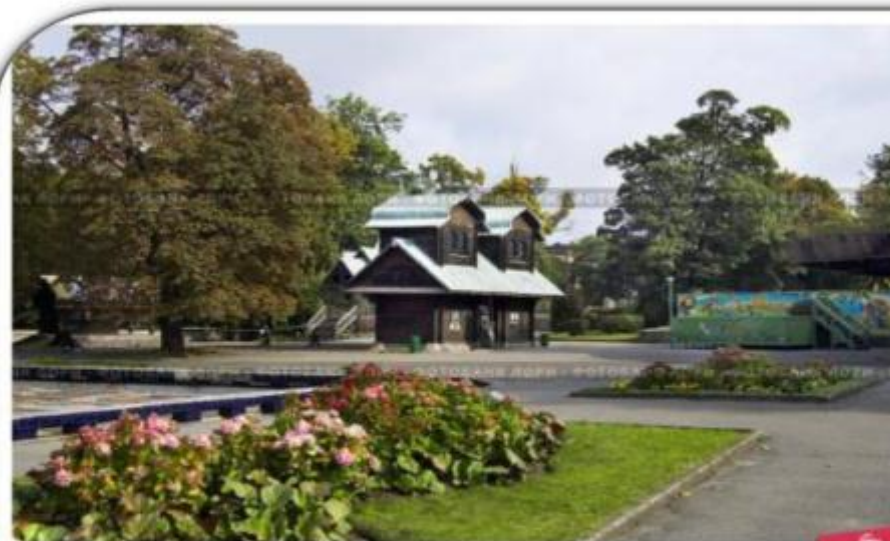
Калининградский зоопарк. Теремок

Один из самых больших и старых зоопарков России. Зоопарк был открыт в 1896 году.