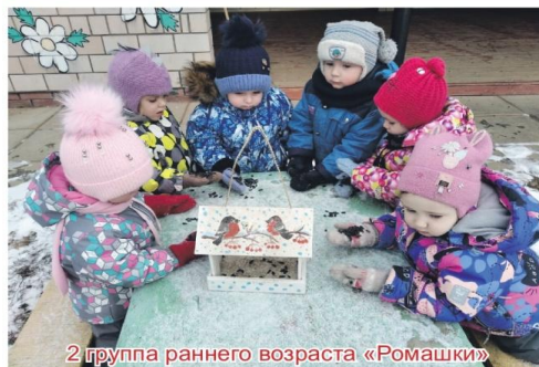
2 группа раннего возраста «Ромашки»

Угощайте птишек дружно, Зёрнышек жалеть не нужно!