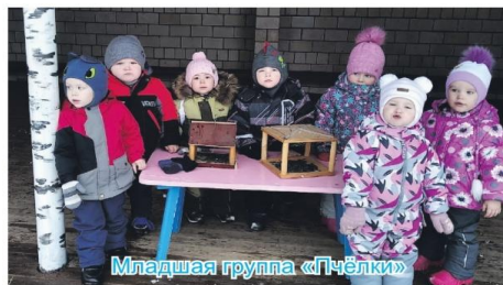
Младшая группа «Пчёлки»

Наш детский сад активно участвует в ежегодной экологической акции «Покормите птиц зимой». Её целью является воспитание заботливого отношения к птицам, желания помогать им в трудных зимних условиях. Готовиться к ней все начинают задолго до наступления холодов. Дети вместе с родителями и воспитателями заготавливают ягоды рябины, семена подсолнечника, пшено, овёс; а из подручного материала изготавливают кормушки, которые затем развешивают около своих домов и на участках детского сада. Ребята с удовольствием подкармливают зимующих птиц и одновременно знакомятся с их повадками, условиями жизни, узнают о пользе пернатых друзей. Птицы прилетают к нам за помощью, и мы с вами должны помочь пережить им зиму. Воспитанники нашего детского сада обращаются и к вам, дорогие читатели: «Покормите птиц зимой! Ведь в этот трудный час, спасенья птицы ждут от нас!»