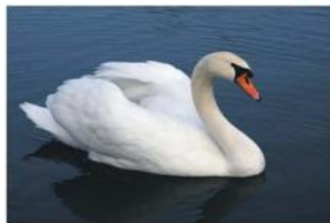
Лебедь – шипун.