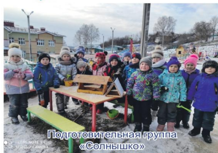
Подготовительная группа «Солнышко»

Мы кормушки смастерили, Мы столовую открыли.