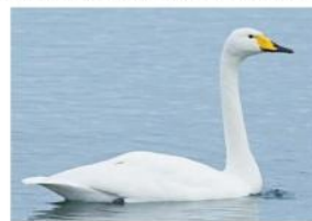
Лебедь – кликун.