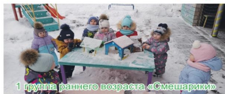
1 группа раннего возраста «Смешарики»

Открыта столовая для наших друзей, Ждём – не дождемся пернатых гостей.