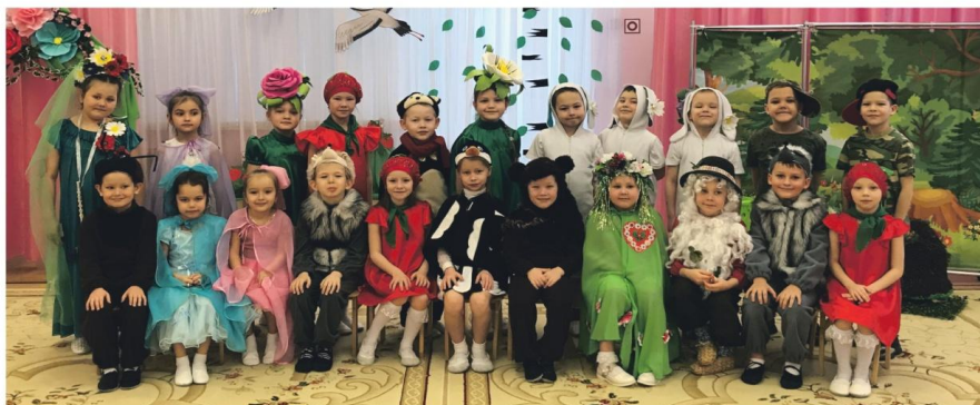
Экологический театр «Муравейник»

Впереди юных артистов ждут новые выступления, новые впечатления и новые зрители!