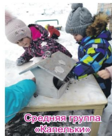
Средняя группа «Капельки»

Мы кормушки смастерили, Мы столовую открыли.