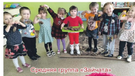
Средняя группа «Зайчата»

Открыта столовая для наших друзей, Ждём – не дождемся пернатых гостей.