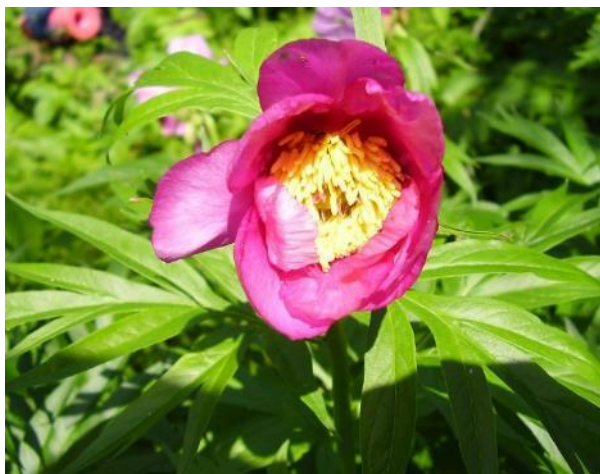
пион уклоняющийся (марьямоль)