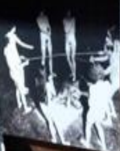
graph with Pins. ... .. ... .. One wonders what the cause ... .. ... .. ... ..