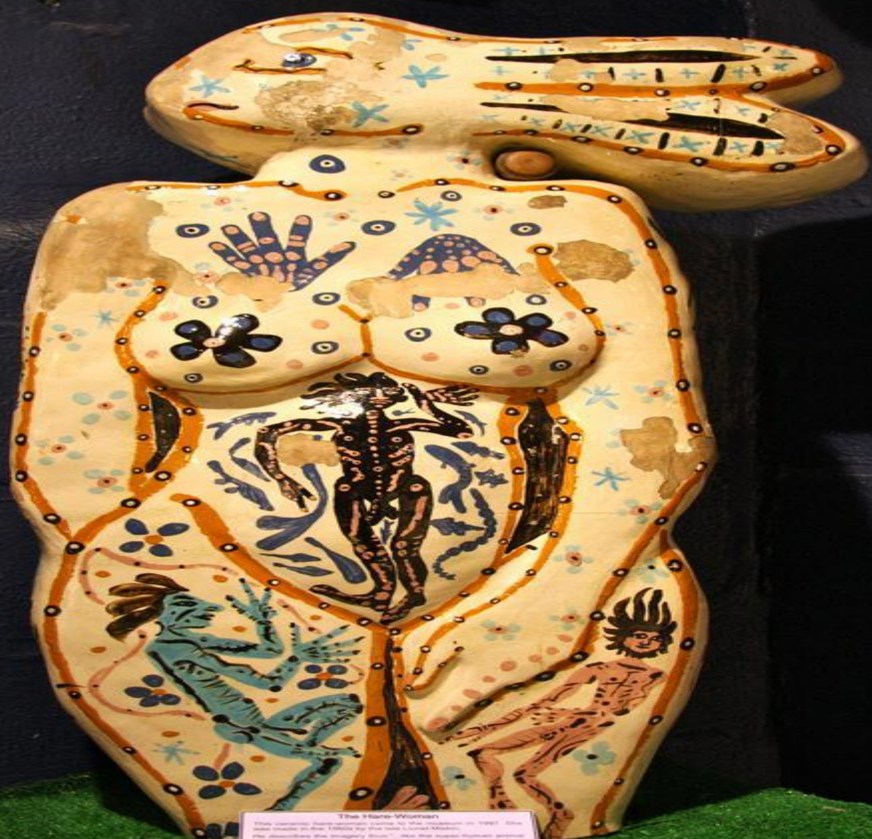
The Hans-Wijeman This ceramic plate, known as the Hans-Wijeman, was discovered in the 1930s in the ruins of the ancient city of Teotihuacan, Mexico. It is a masterpiece of pre-Columbian art, featuring a central figure with a black body and a sun-like head, surrounded by other figures and symbols. The plate is decorated with blue, black, and orange pigments. It is surrounded by other artifacts, including a wooden fragment with the word 'DÄDE' and a piece of gold jewelry.