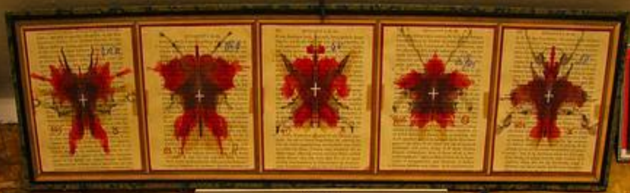
Valva Magica This strange book has 148 drawings of symbols labeled on the sides. The label reads: "In a letter des magies, Paris 1584. 16 pages. Valva quadrata seu valva magica. Antwerp 1584. The contents would take to know more about this book."