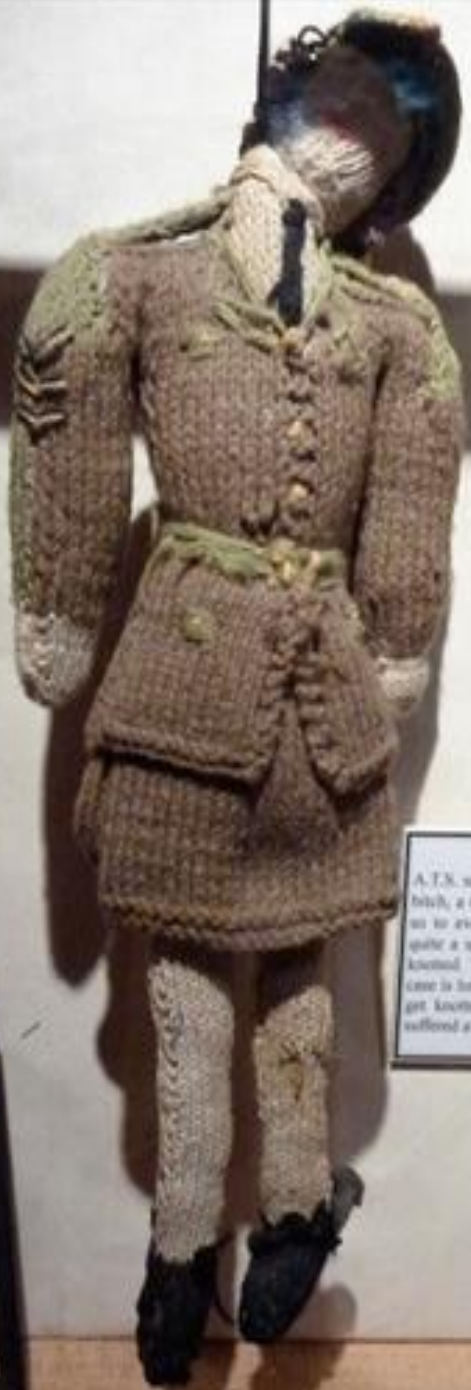
A.T.S. ... ... .. ... .. ... .. ... .. ... .. ... ..