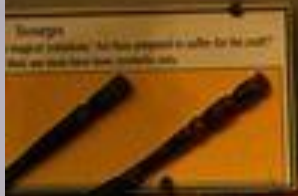
Daggers "Magical instruments" - "Are these prepared to suffer for the good?" "But are made from iron, steel, or lead."