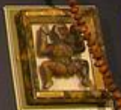
Small figure originally from Valvula quadrata, 1584. The figure may be a key or another symbol.