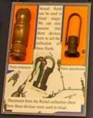
These items can be used in ritual magics. We can only assume they were devices used to aid the initiation of these folks. From a manuscript Document from the Witch's collection show how these devices were used in ritual.