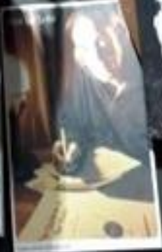
Handmade... ... .. ... .. ... .. ... .. ... .. ... .. ... ..