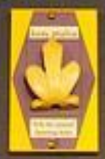
Flower symbol in the piece