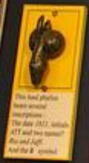
This leaf phylax has several inscriptions. The day 1555 initials ATJ and two names? Row and left And the B. symbol