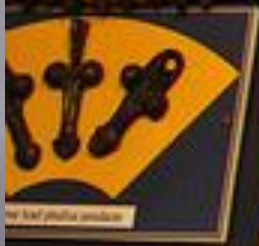
Key leaf phylax amulet