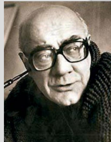
Мераб Мамардашвили 1930 – 1990 гг.

Люди, желающие приобщиться к философской культуре, должны идти к этому через свой собственный духовный опыт. Только вопросы, вырастающие из этого опыта, и являются проблемами, на которые можно искать ответ, обращаясь к философским понятиям.