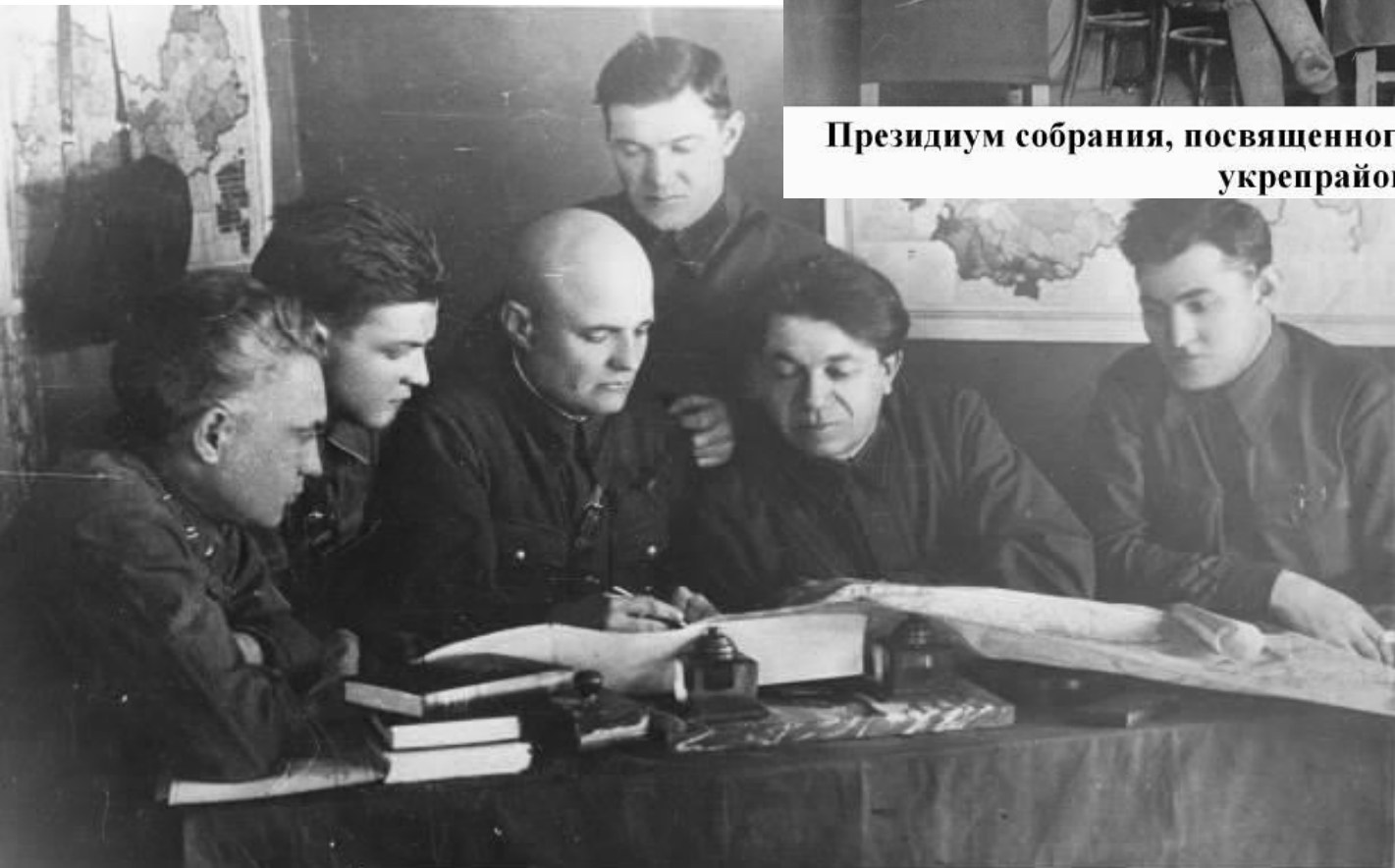
Заседание комиссии по строительству Сурского укрепрайона. 1941г.