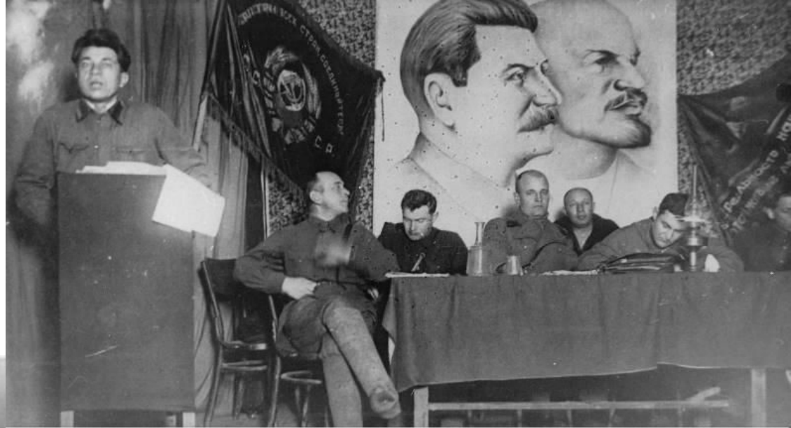
Президиум собрания, посвященного строительству Сурского укрепрайона