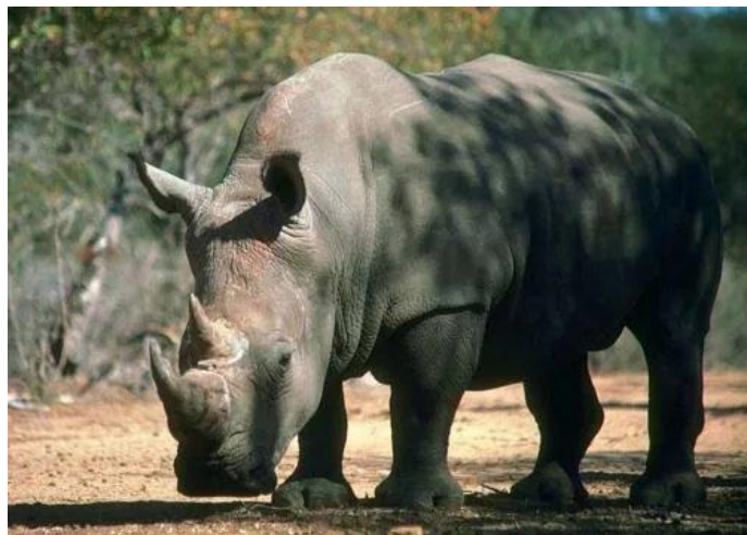
Большой Индийский носорог.