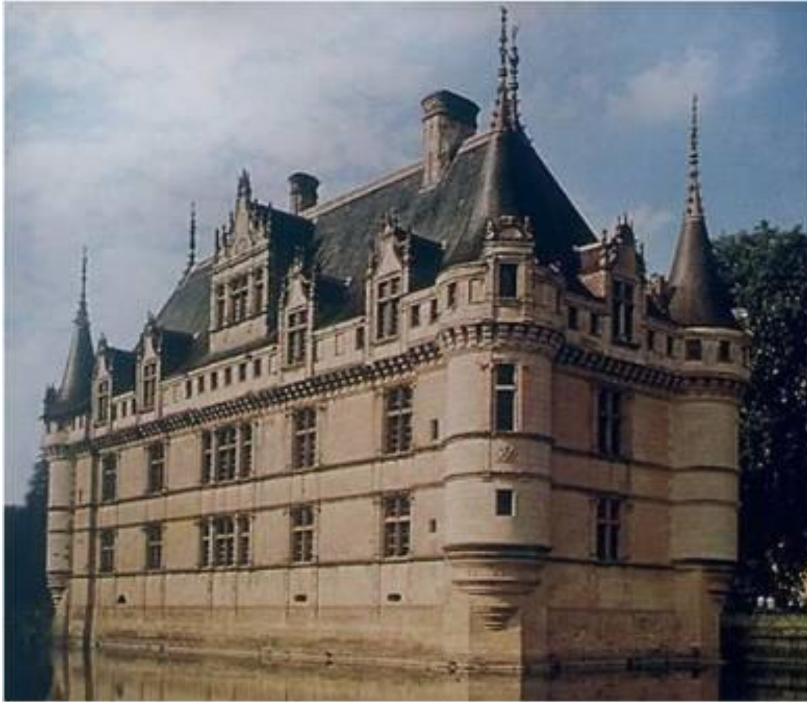
Замок Азе-ле-Ридо в 16 в. Франция

Замок - укреплённое жилище феодала в средневековой Европе.