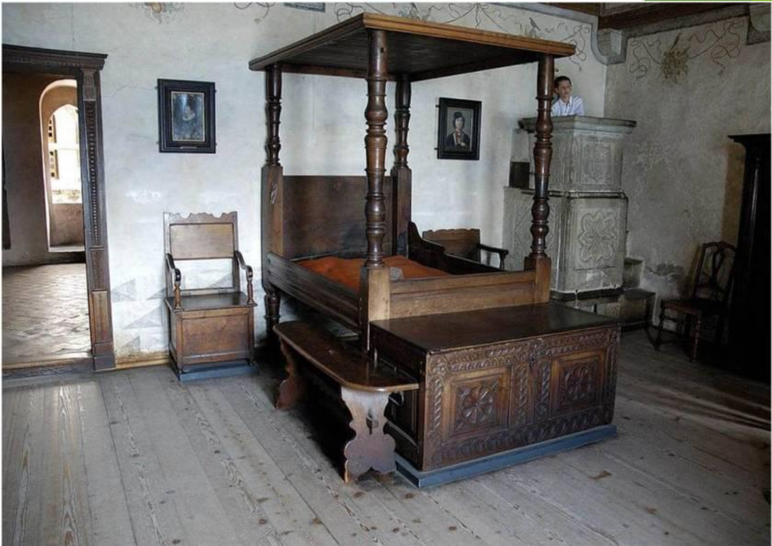
Спальня хозяев замка. Реконструкция.