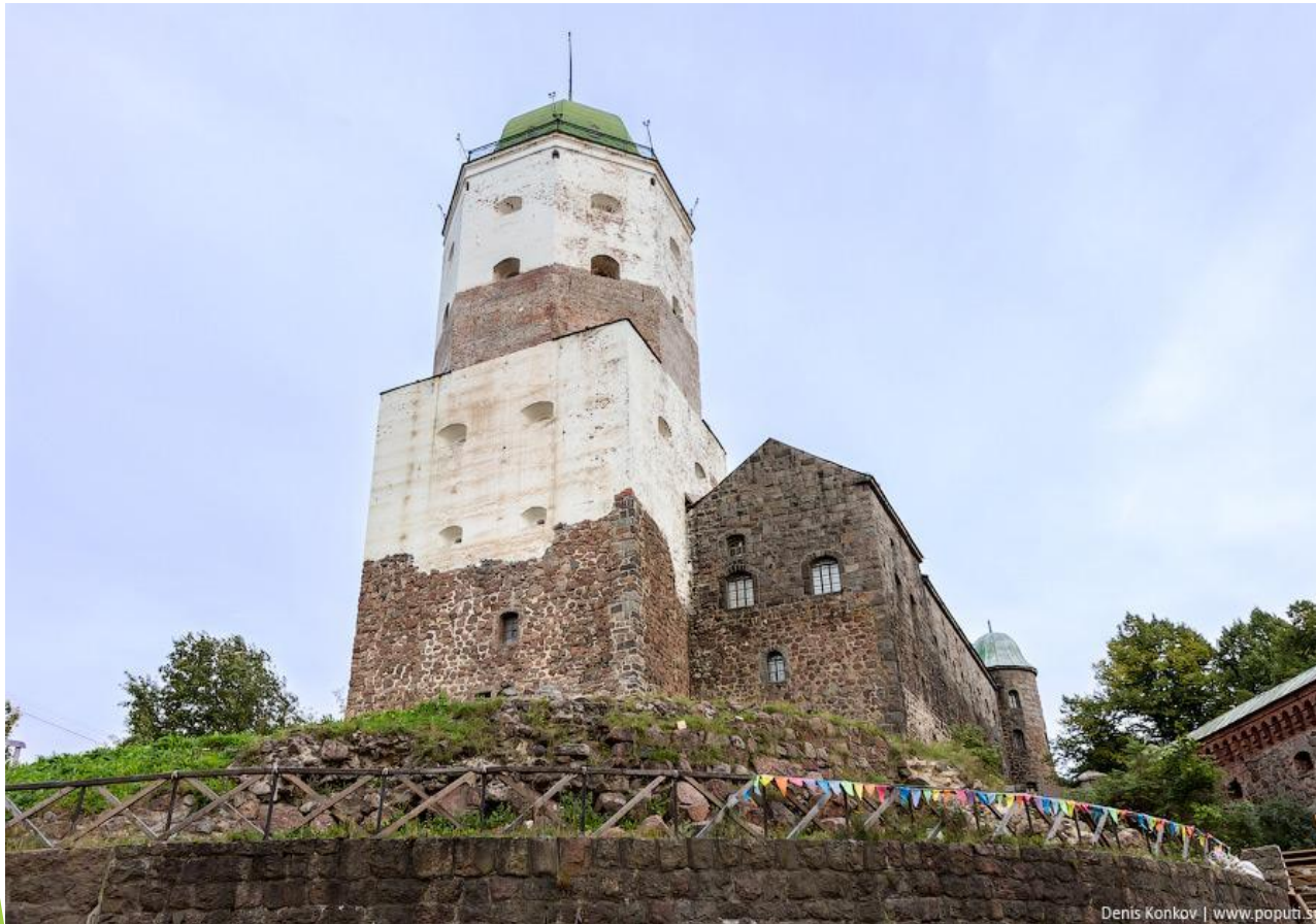
Донжон Выборгского замка

Внутреннее устройство замков отличалось многообразием. За главными воротами мог располагаться маленький прямоугольный дворик с бойницами в стенах — своеобразная “ловушка” для нападающих. Непременным атрибутом замка был большой двор (хозяйственные постройки, колодец, помещения для челяди) и центральная башня, она же “донжон” (donjon).