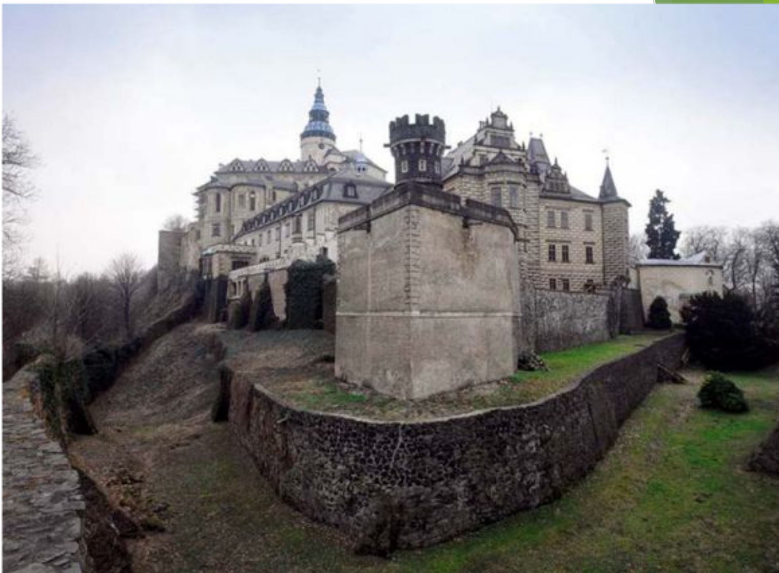
Замок Фридлант. Чехия