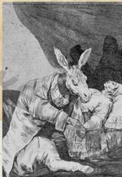
De que mal morira!