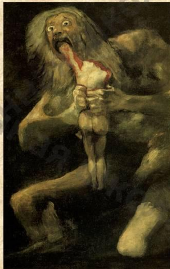
Сатурн, пожирающий своего сына