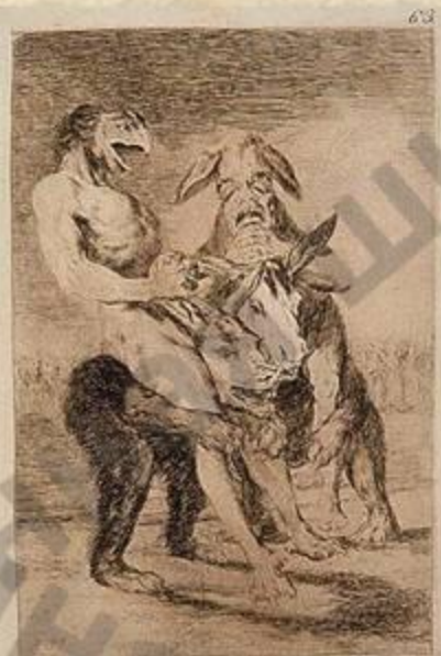
Miren que graves!