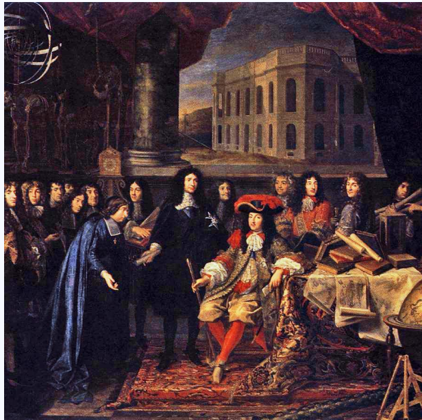
АБСОЛЮТИЗМ ВО ФРАНЦИИ XVI – XVIII ВВ.