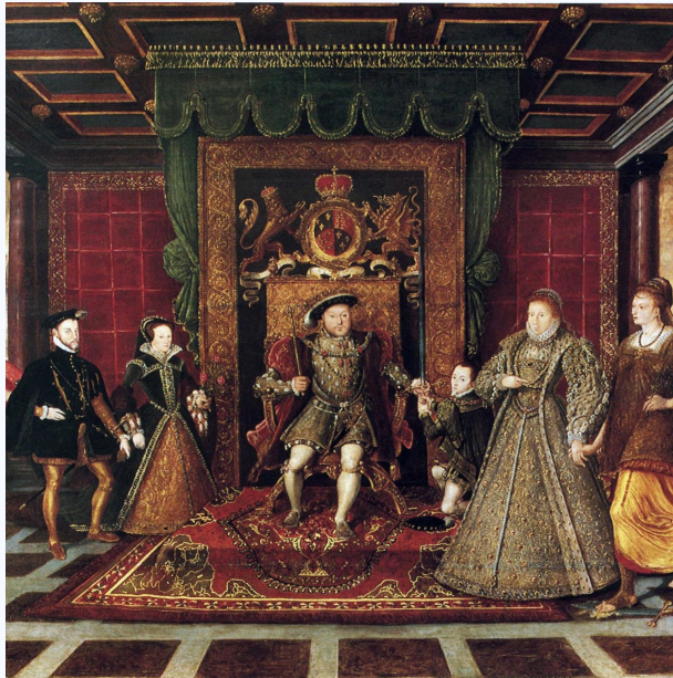
АБСОЛЮТИЗМ В АНГЛИИ XVI – XVIII ВВ.