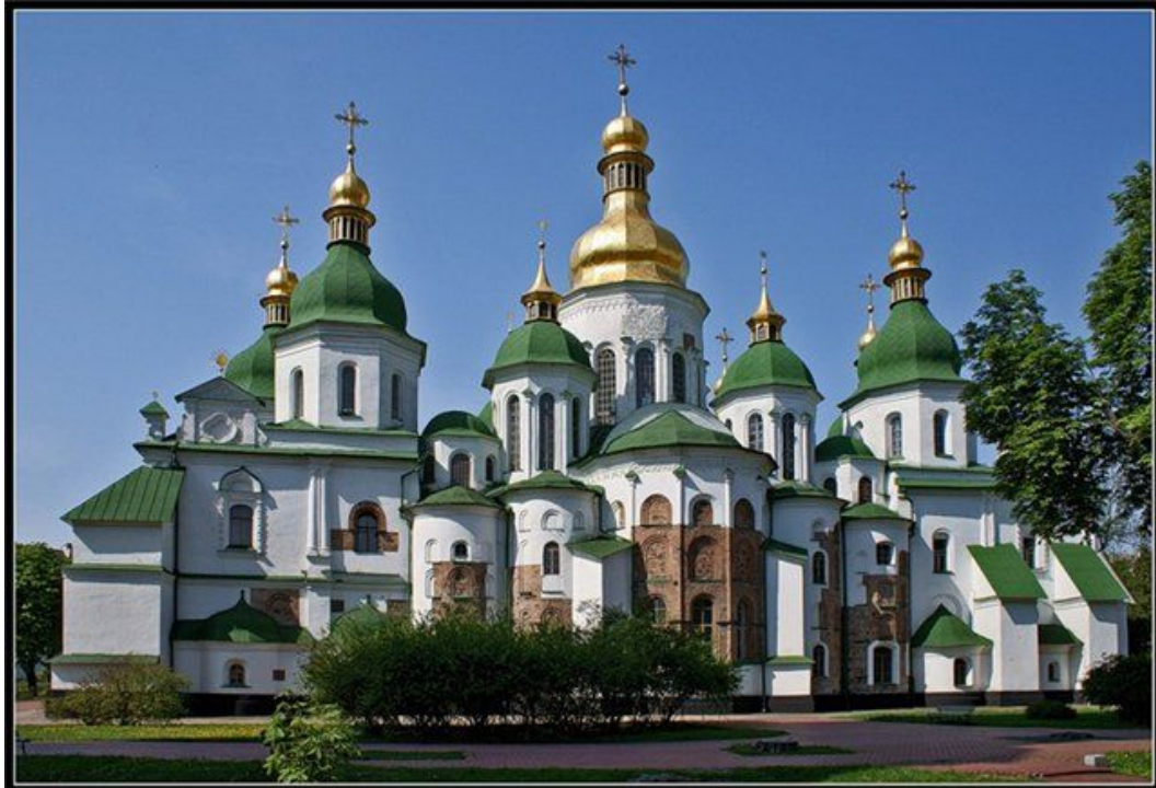
Софийский собор в Киеве