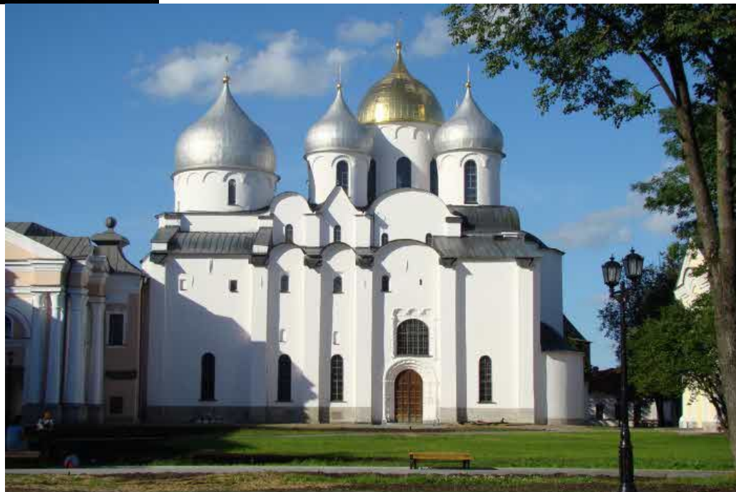
Софийский собор в Новгороде