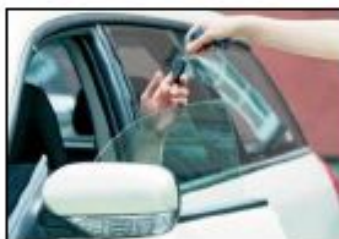
ПРОКАТНЫЕ ТС и ТС, СДАВАЕМЫЕ В АРЕНДУ