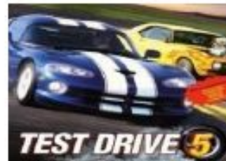
ИСПОЛЬЗУЕМЫЕ ДЛЯ ТЕСТ – ДРАЙВА