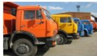
ГРУЗОВЫЕ АВТО СЕДЕЛЬНЫЕ ТЯГАЧИ