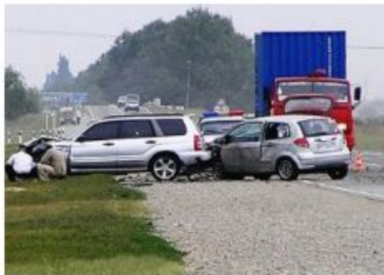
В процессе движения ТС