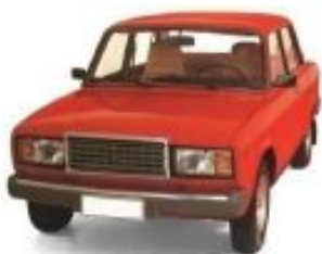
ТС отечественного производства