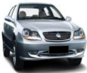
ТС иностранного производства