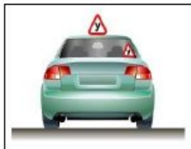
ИСПОЛЬЗУЕМЫЕ ДЛЯ УЧЕБНОЙ ЕЗДЫ