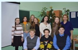
Редакция газеты Президент Вице-президент Секретарь Корректор Главный редактор Заместитель главного редактора Секретарь по связям с общественностью Секретарь по связям с родителями Секретарь по связям с учениками Секретарь по связям с учителями Секретарь по связям с администрацией Секретарь по связям с родителями Секретарь по связям с учениками Секретарь по связям с учителями Секретарь по связям с администрацией

Спустя полтора года Клуб журналистов возобновляет свою деятельность. Мы будем рассказывать вам о самых интересных событиях, происходящих в нашей Гимназии, отмечать достижения учеников. Надеемся что вы будете нам помогать в создании новых интересных номеров, отвечая на наши вопросы во время интервью. Представляем вам первый номер гимназической газеты.