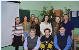
Редакция газеты Администрация гимназии Учителя Ученики

Спустя полтора года Клуб журналистов возобновляет свою деятельность. Мы будем рассказывать вам о самых интересных событиях, происходящих в нашей Гимназии, отмечать достижения учеников. Надеемся что вы будете нам помогать в создании новых интересных номеров, отвечая на наши вопросы во время интервью. Представляем вам первый номер гимназической газеты.