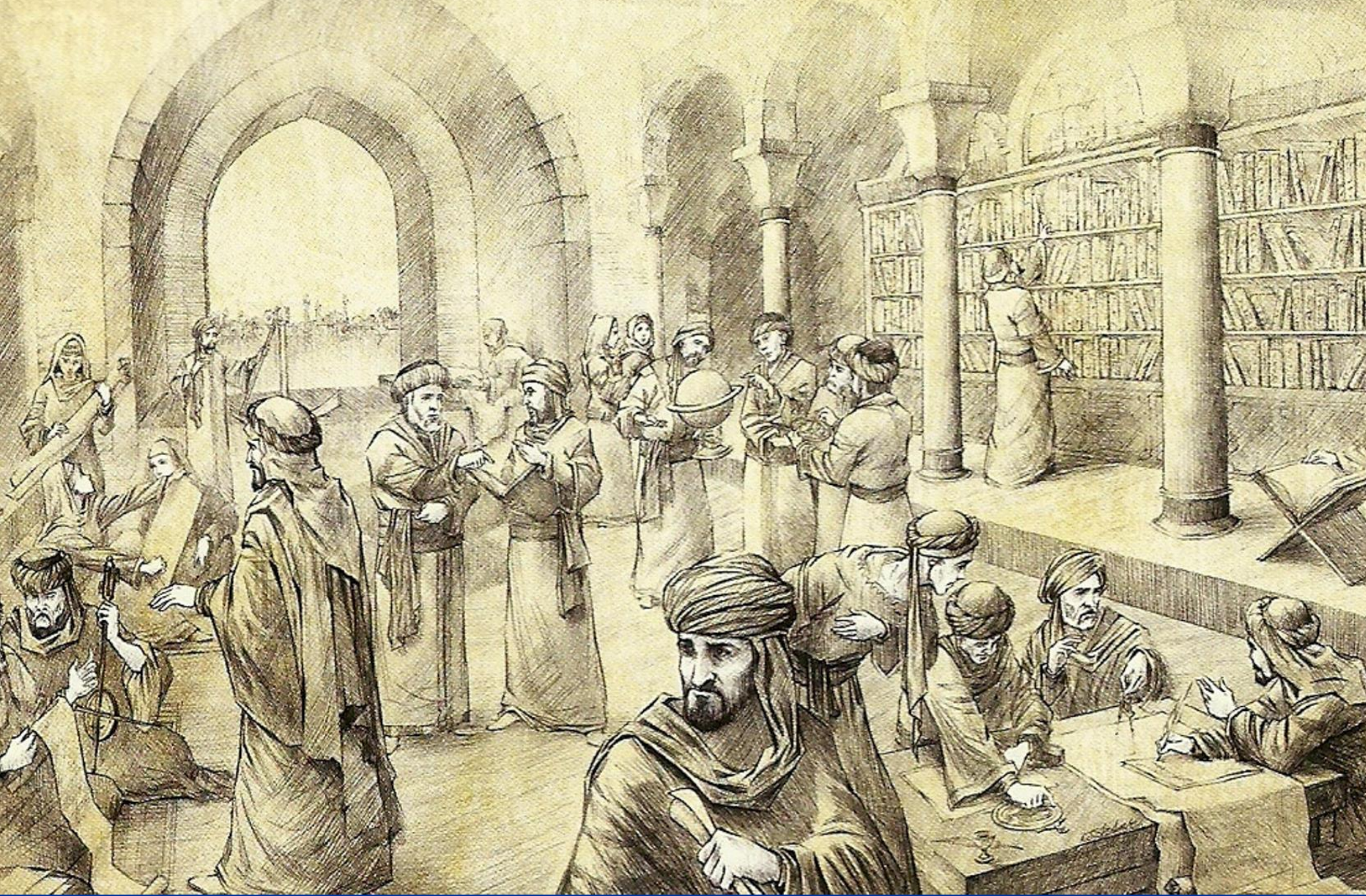
«Дом Мудрости» в Багдаде. Рисунок