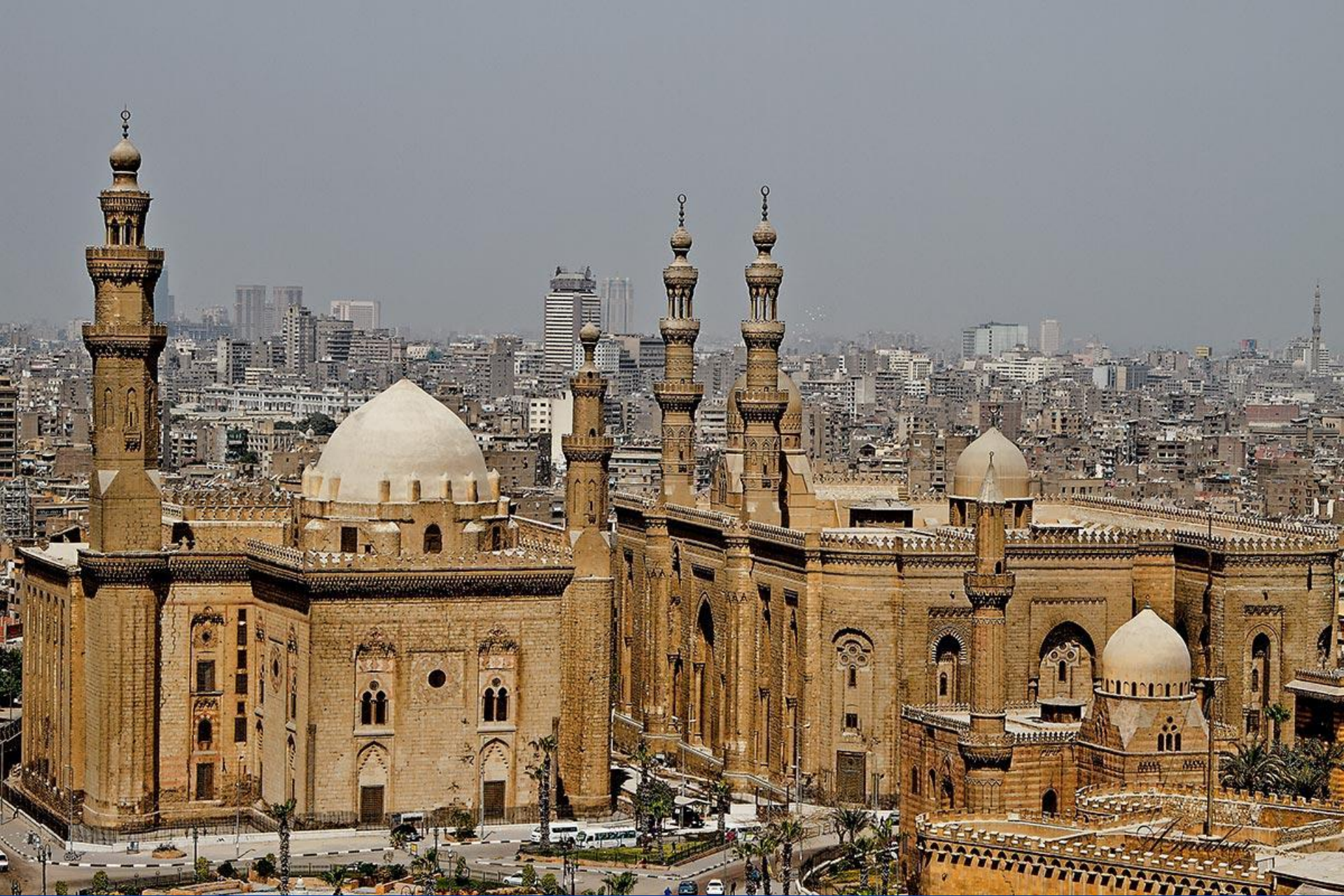
Мечеть Хассана. Каир. Египет. XIV в. Фото