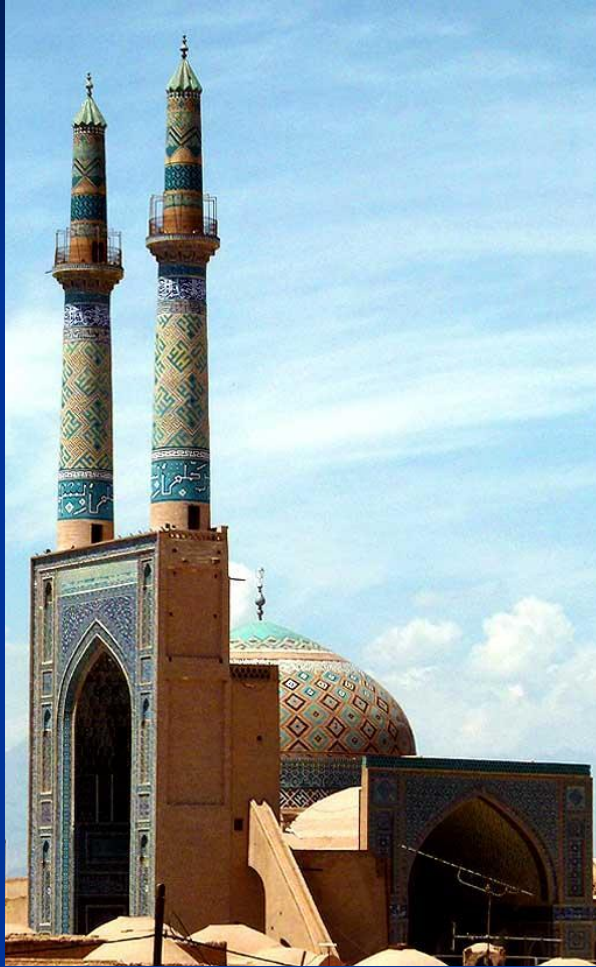
Мечеть и минареты. XII в. Иран. Фото