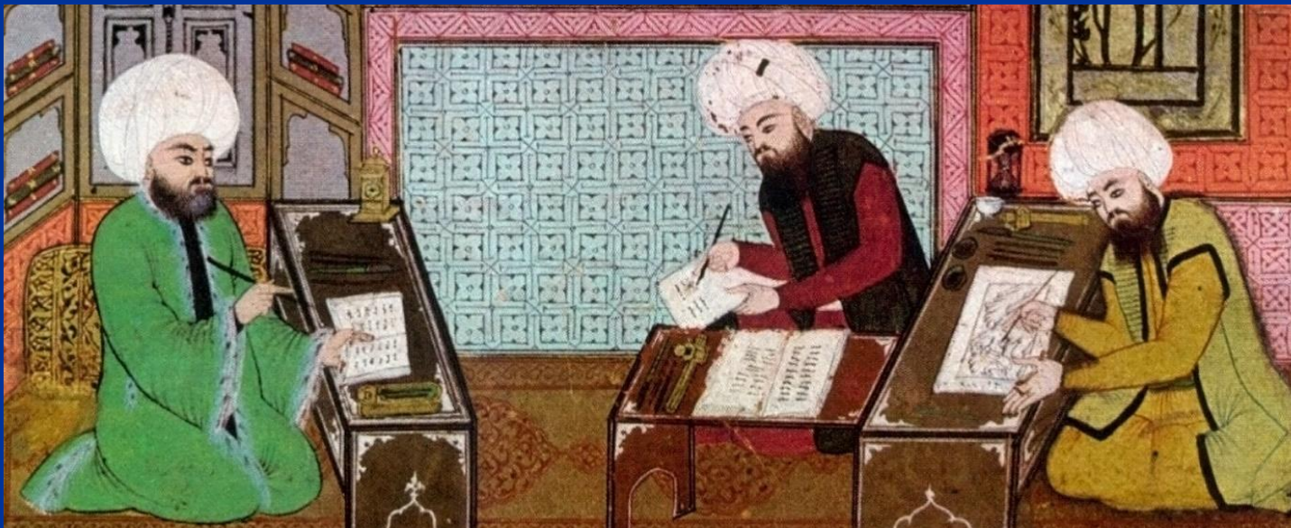
Ученики в медресе. Арабский рисунок