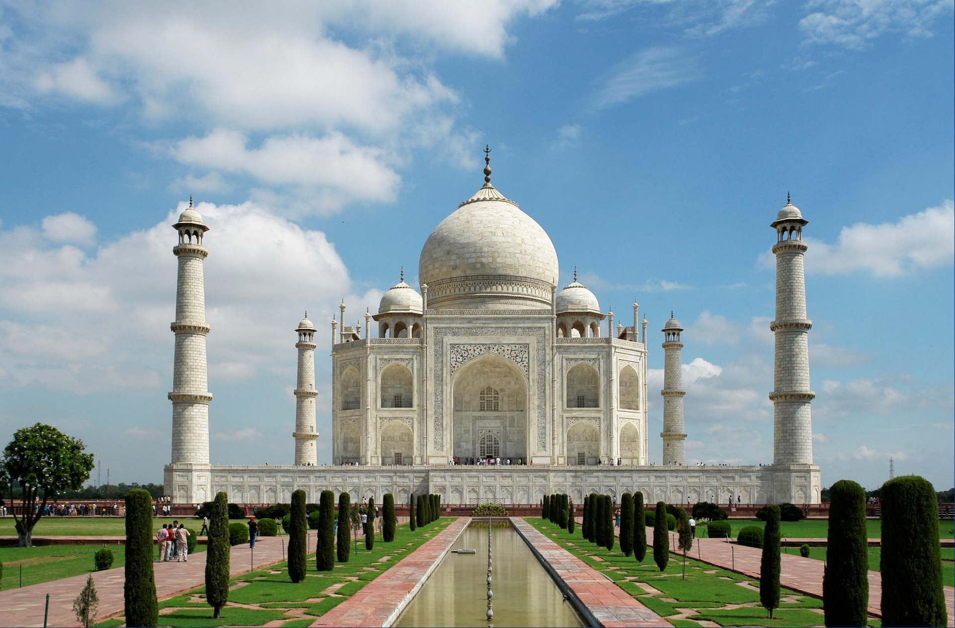
Мечеть и минареты Тадж-Махал. Индия. Фото