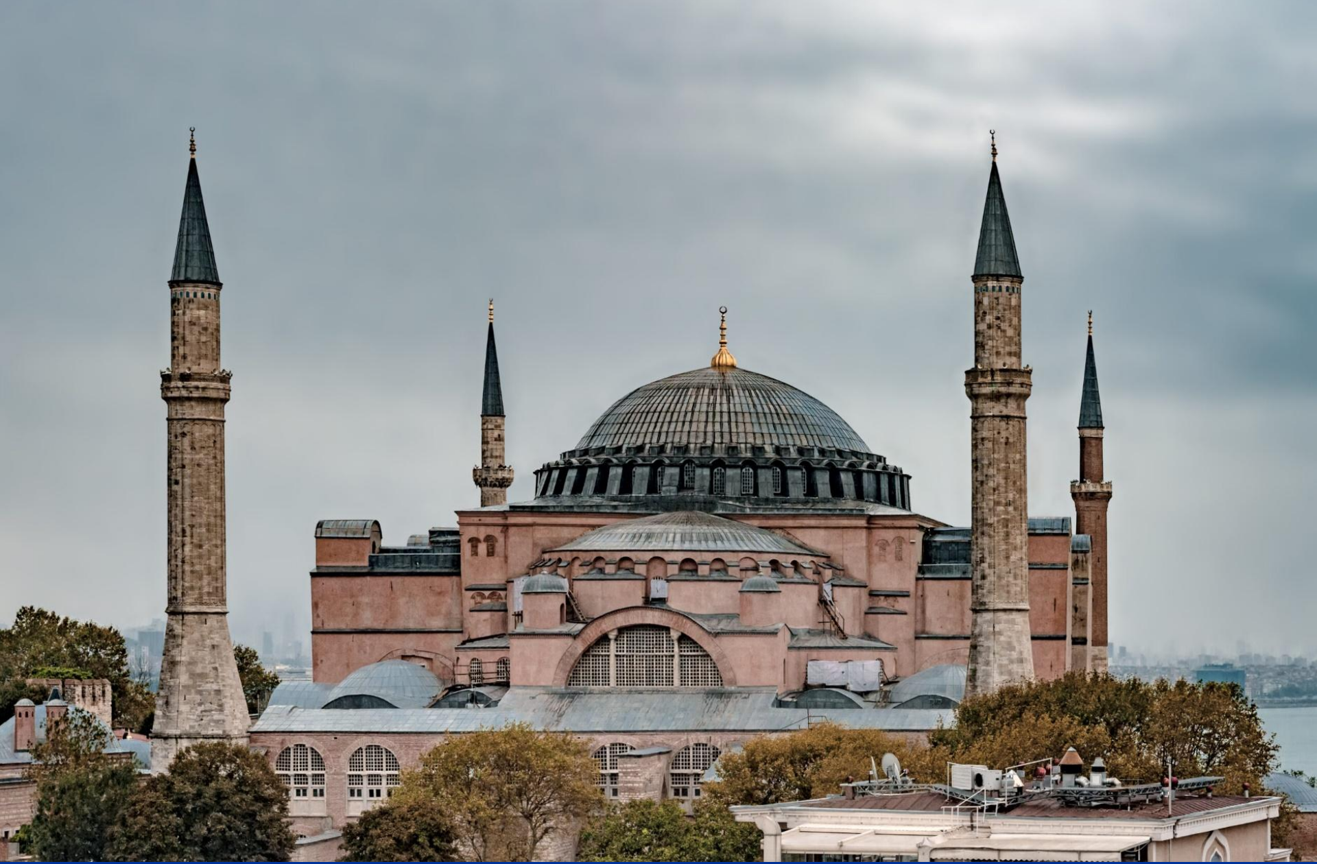
Мечеть Айя-София (собор Святой Софии). Стамбул. Турция. VI в. Фото