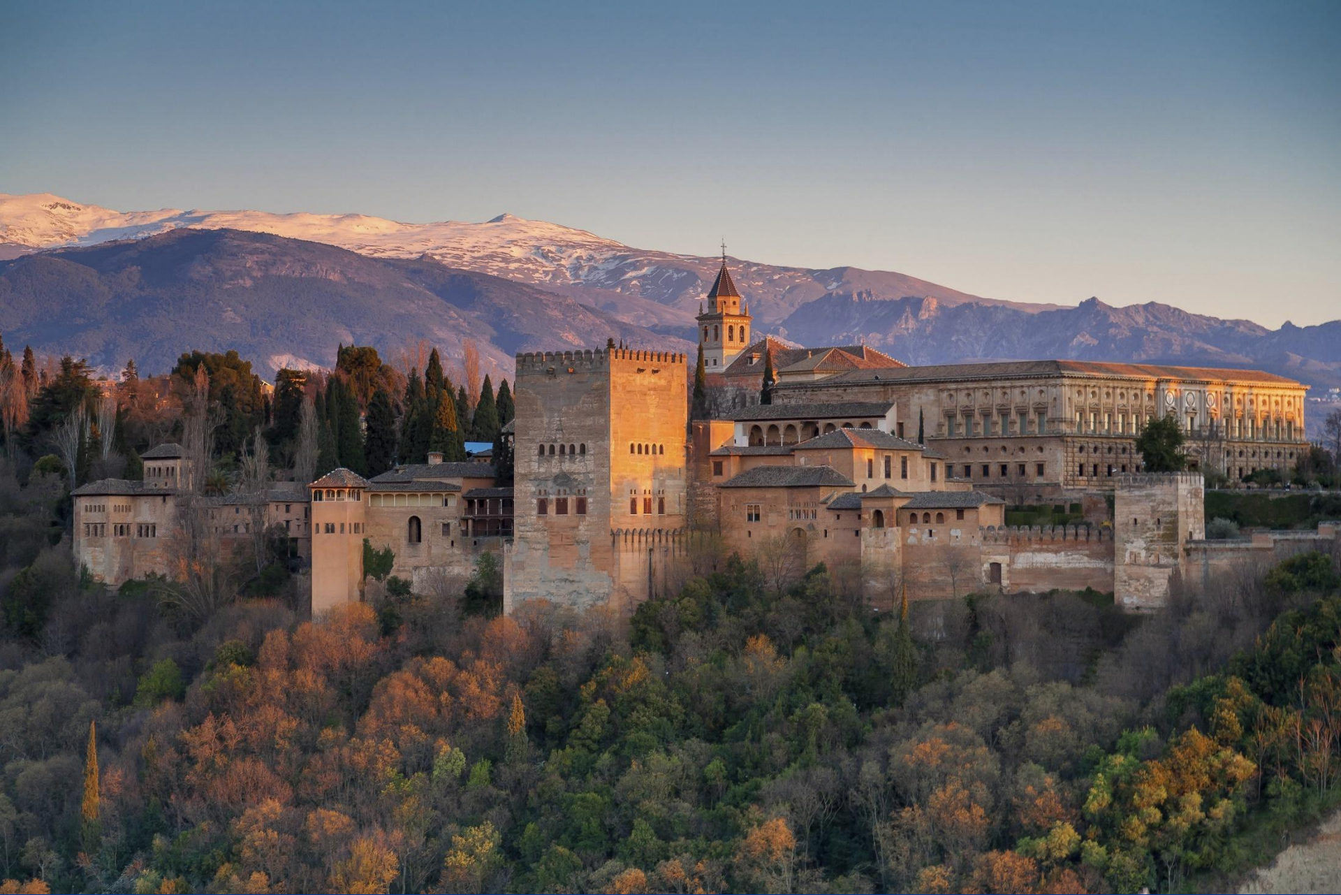
Дворец. Альгамбра. Гранада. Испания. Фото