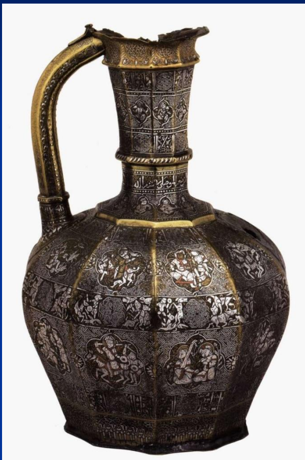
Арабский кувшин. XII в. Фото