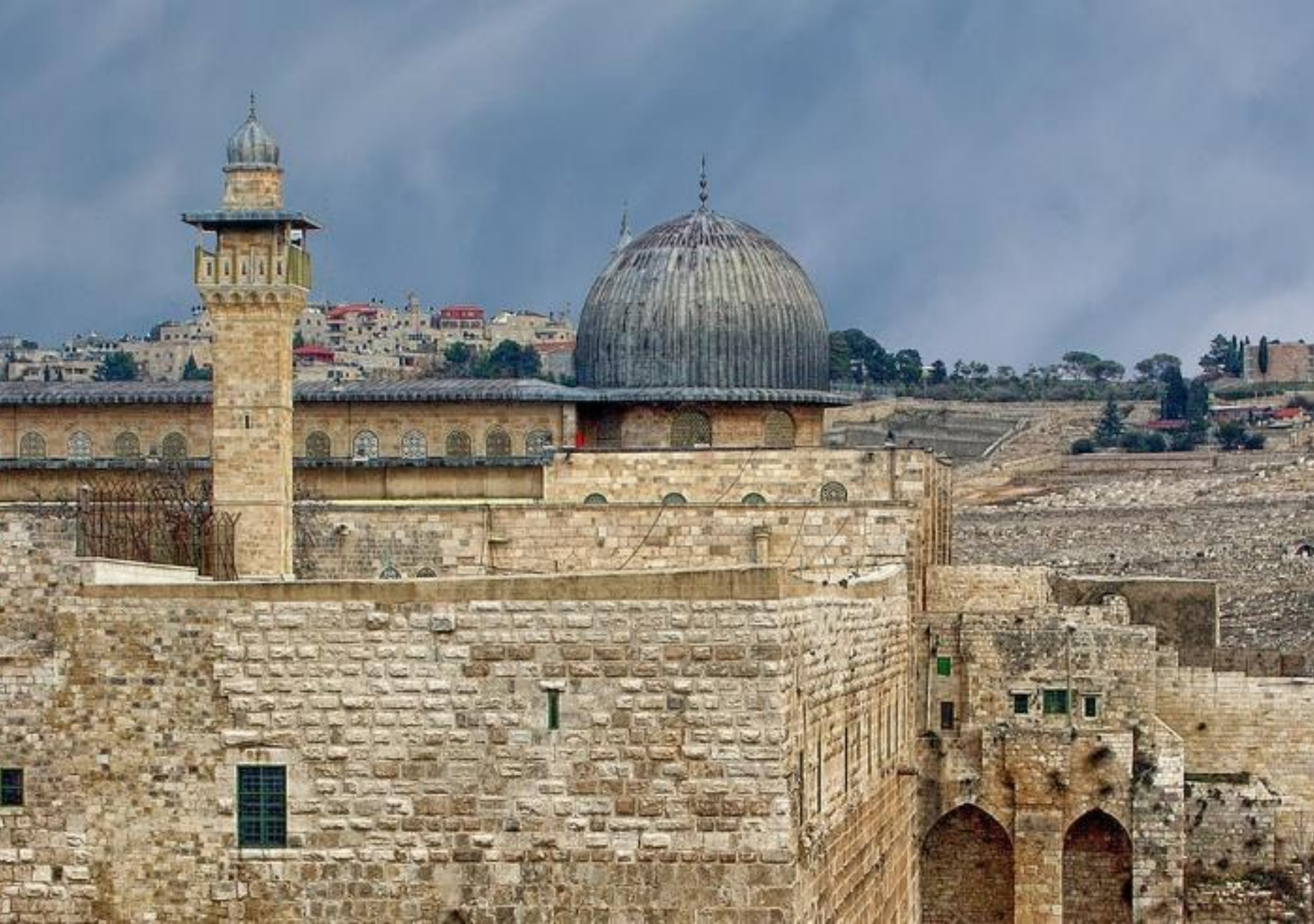
Мечеть Омара (Аль-Акса). Иерусалим. XI в. Фото