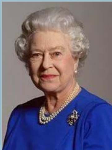
Елизавета II (монарх)

Великобритания — конституционная монархия во главе с королевой. Законодательный орган — двухпалатный парламент (Монарх + Палата общин + Палата лордов - так называемая система King (Queen) in Parliament). Парламент является высшим органом власти на всей территории, несмотря на наличие в Шотландии, Уэльсе и Северной Ирландии собственных управленческих административных структур. Правительство возглавляет монарх, непосредственное управление осуществляется премьер-министром, назначаемым монархом, который, таким образом, является председателем Правительства Его (Её) Величества.