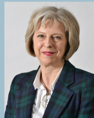
Тереза Мэй (Премьер-министр)