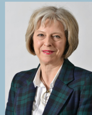
Тереза Мэй (Премьер-министр)