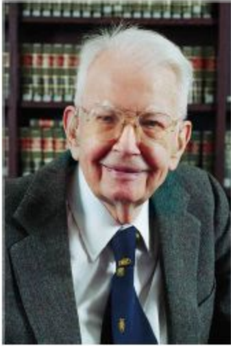
Рональд Коуз (р. 1910)

Американский экономист, лауреат Нобелевской премии по экономике. Прояснил смысл изучения трансакционных издержек и институтов в экономической теории. Издержки обмена зависят от институтов. Чем ниже издержки обмена, тем глубже специализация, и тем выше продуктивность экономики.