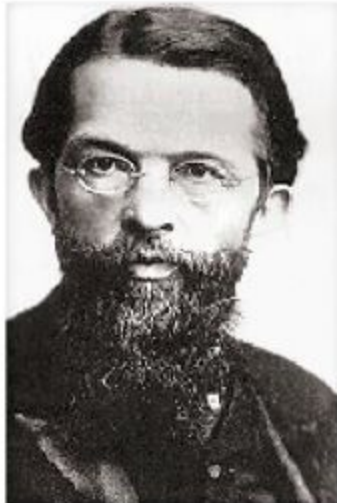
Карл Менгер (1840-1921)

Австрийский экономист, основатель австрийской школы политической экономики. Являясь одним из участников «маржиналистской революции», выделялся последовательным подчеркиванием субъективных элементов экономической деятельности.