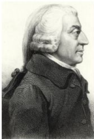
Адам Смит (1723-1790)

Шотландский экономист и философ, первый классик экономической науки. Источник увеличения богатства по Смиту – повышение производительности труда, что достигается путем разделения труда. В свою очередь, причиной разделения труда является обмен.