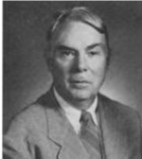
Уолтон Гамильтон (1881-1958)

Впервые термин институциональная экономика предложил американский экономист Уолтон Гамильтон.