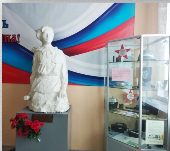
Школьный музей Боевой славы имени Марии Поливановой (с. Спас-Конино)