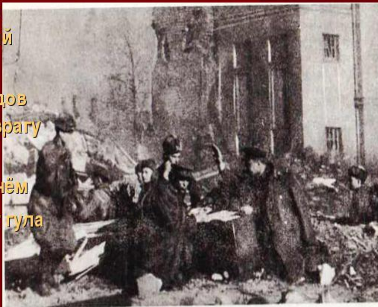
В дни штурма Кёнигсберга