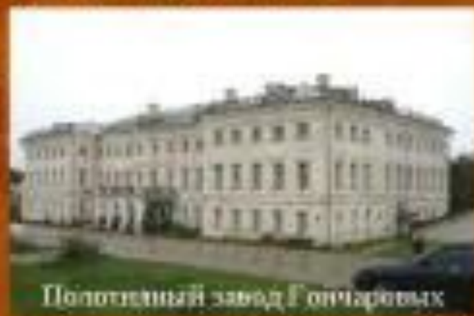
Полотняный завод Гончаровых