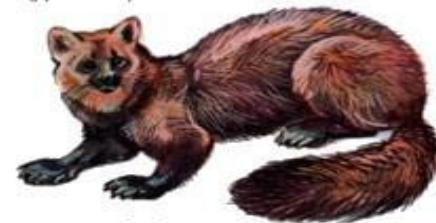
Соболь (до 53 см)