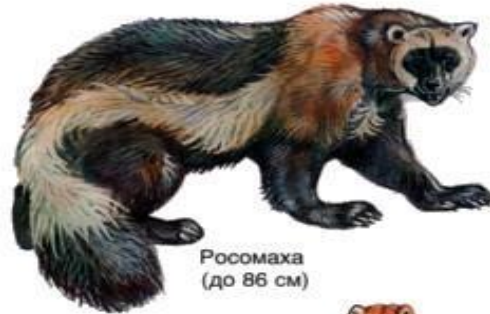
Росомаха (до 86 см)