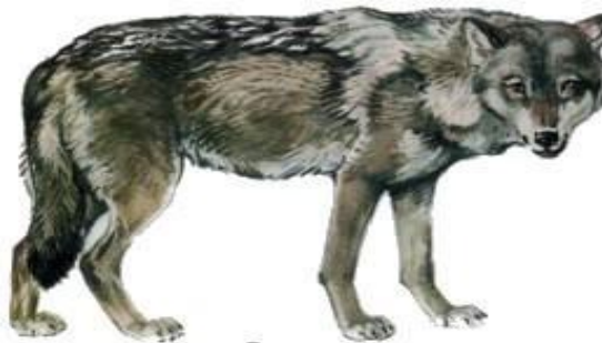
Волк (до 1,6 м)