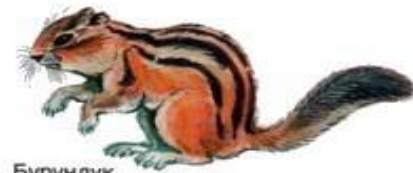
Бурундук (до 16 см)