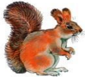
Белка (до 28 см)