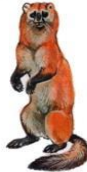
Колоннок (до 39 см)