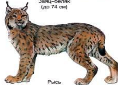
Рысь (до 1.5 м)