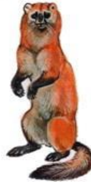
Колоннок (до 39 см)