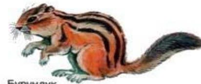
Бурундук (до 16 см)