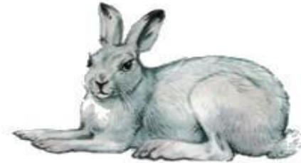
Заяц-беляк (до 74 см)