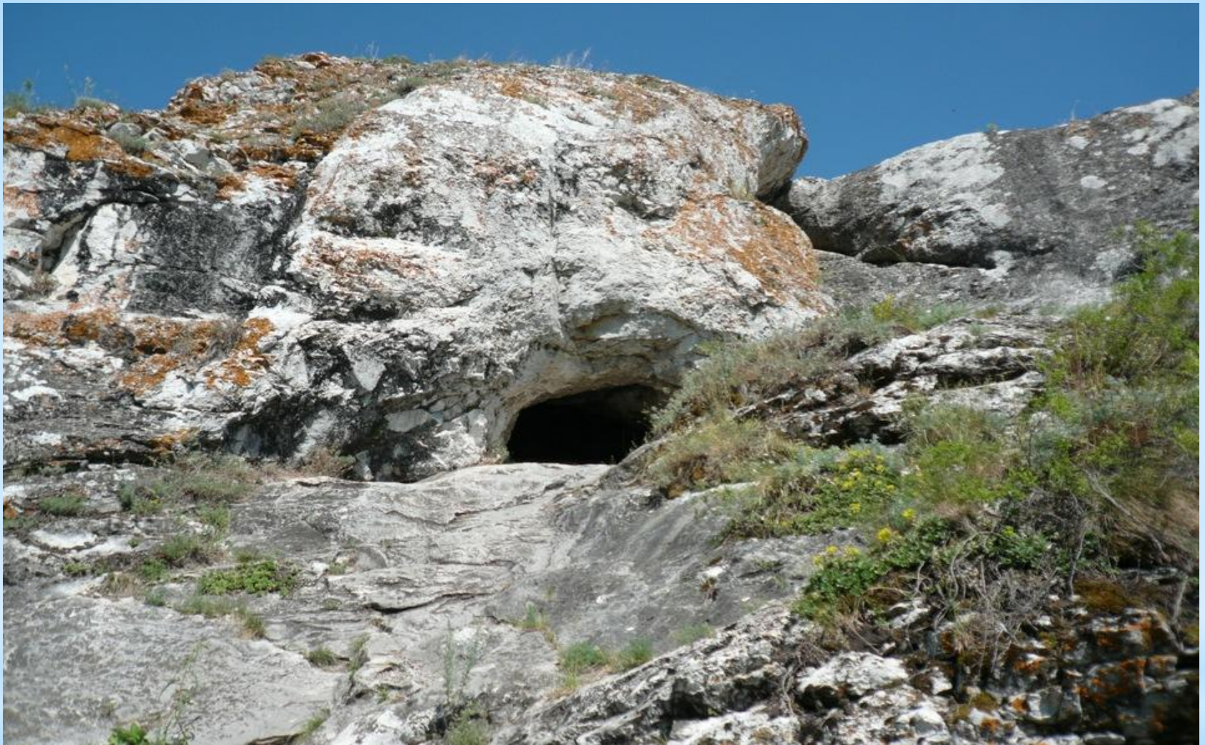
Жемерякский карстовый Лог