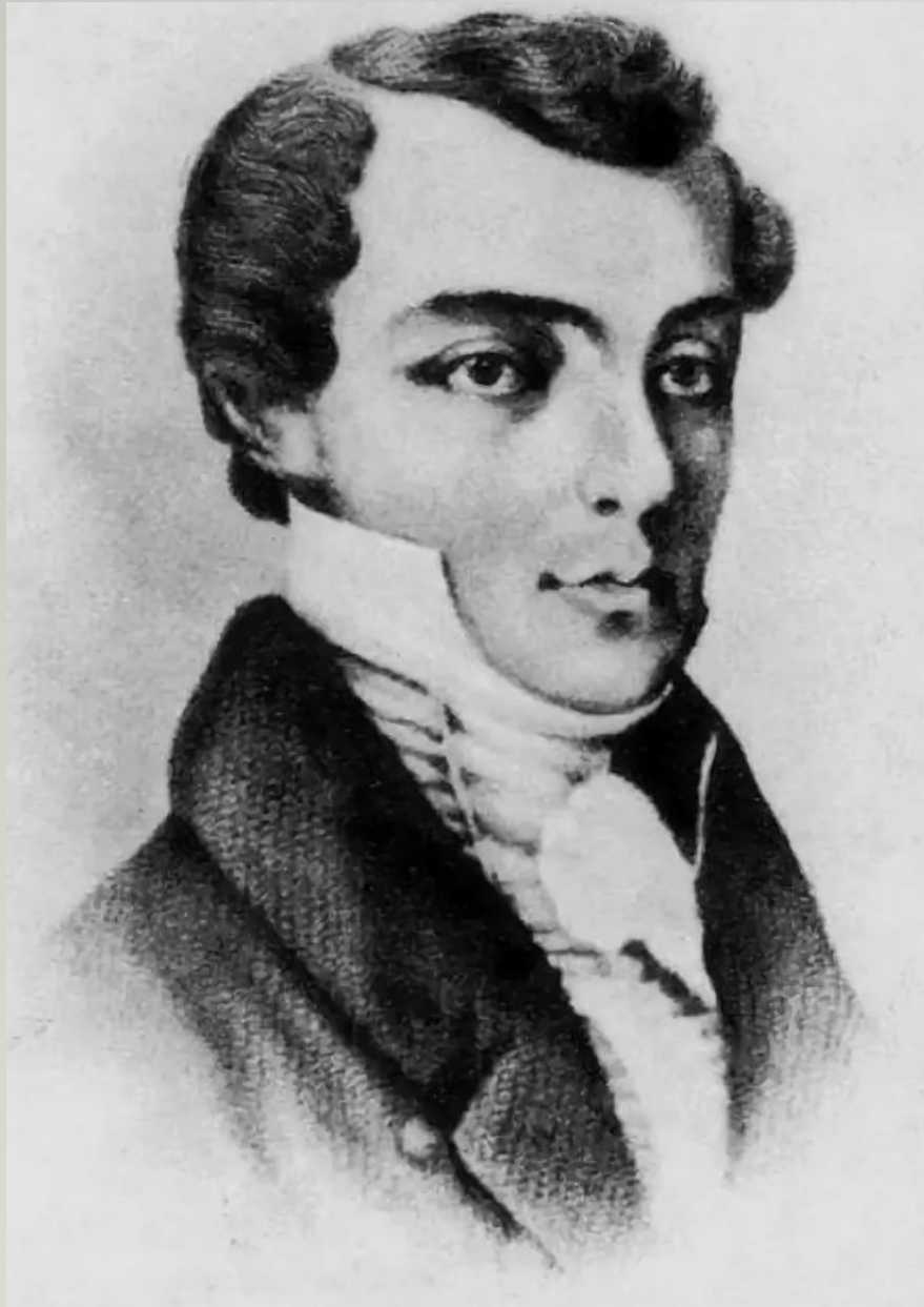
К.Ф.Рылеев (1795 – 1826)