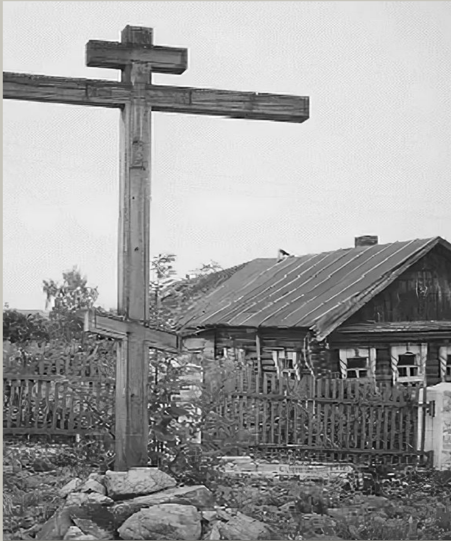
Деревянный крест на могиле И. Сусанина