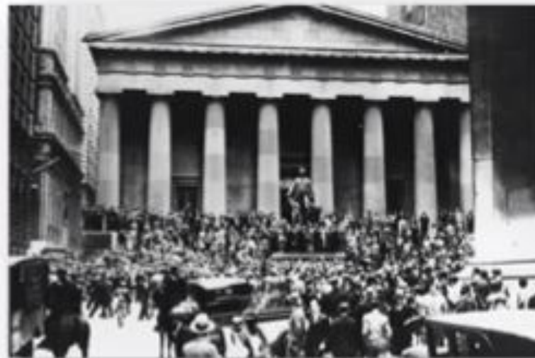
Биржевой крах 1929 года

Фондовая биржа — это специализированная организация, которая предназначена для обращения ценных бумаг и взаимодействия между инвесторами и предпринимателями Акция — ценная бумага, предоставляющая её владельцу право на участие в управлении акционерным обществом и право на получение части прибыли в форме дивидендов.