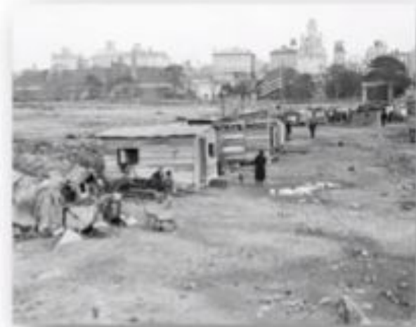
1933 год. Гувервилль в Центральном парке, Нью-Йорк

Значительно изменился быт американцев, увеличение числа бездомных