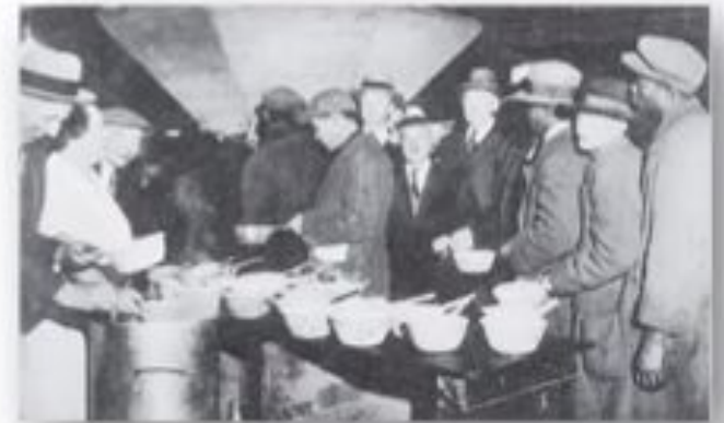
Очередь за бесплатным супом в Нью-Йорке. 1932 г.