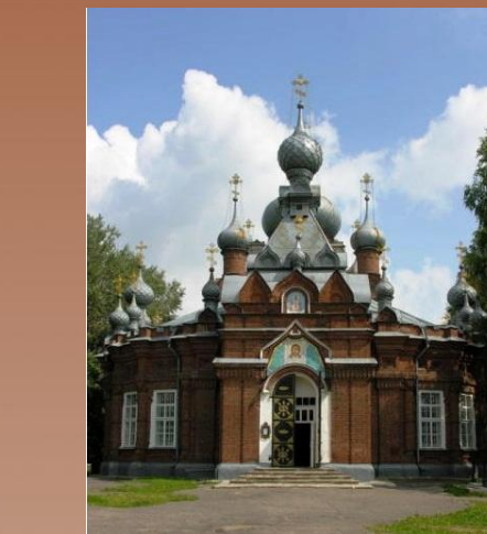
Храм Спаса Нерукотворного