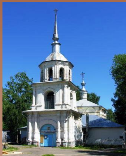
Крестовоздвиженска я церковь