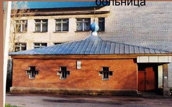
Церковь Великомученицы Елизаветы