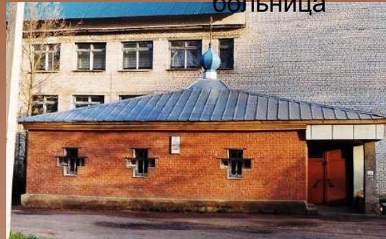
Церковь Великомученицы Елизаветы