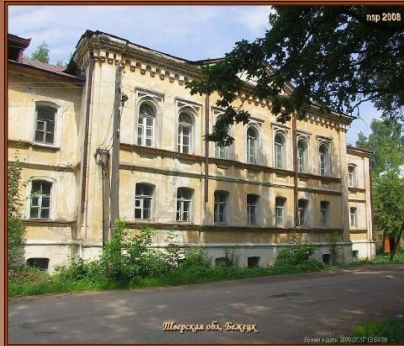
Домовая церковь Косьмы и Домиана