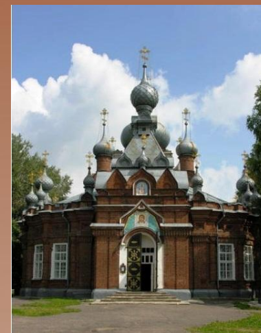
Храм Спаса Нерукотворного