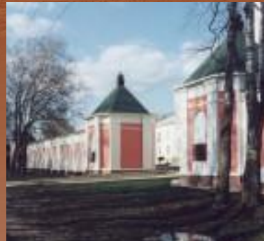
Территория бывшего Благовещенского монастыря