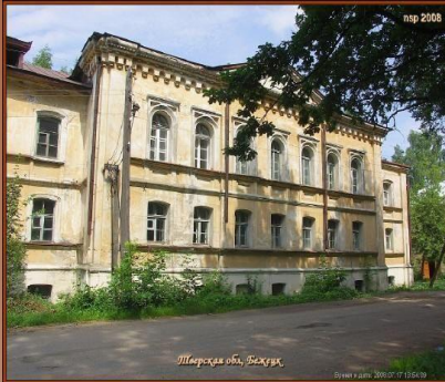
Домовая церковь Косьмы и Домиана