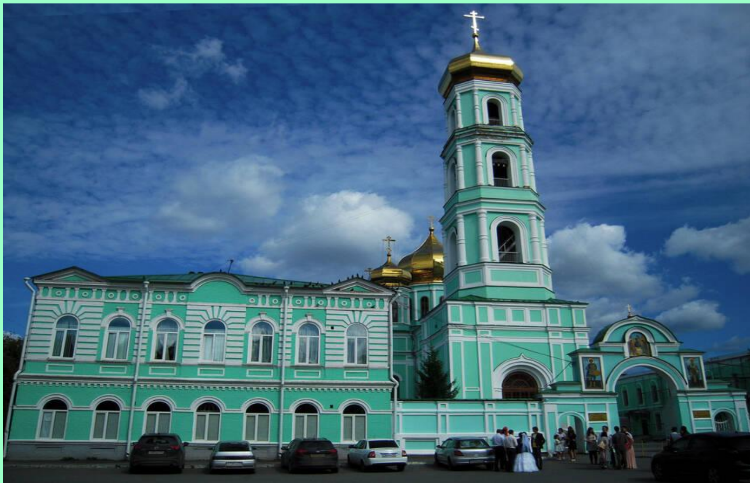
Кафедральный Спасо - Преображенский храм г. Пермь