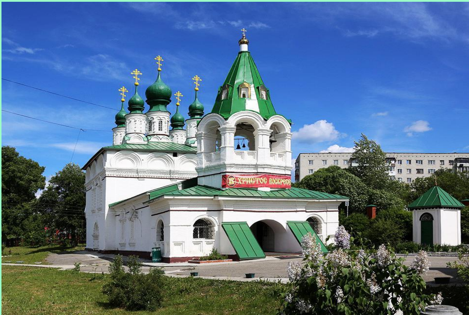
Кафедральный Спасо - Преображенский храм г. Соликамск