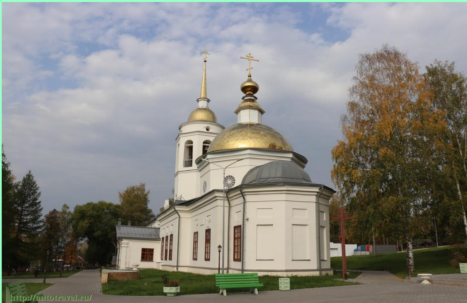
Кафедральный Спасо - Никольский храм г. Кудымкара