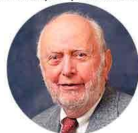
Дуглас Норт. Американский экономист.

По Норту, у простой статической модели есть два ограничения. Во-первых, это уровень политической конкуренции, внутренней и внешней. Во-вторых, это собственные транзакционные издержки правителя