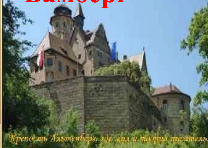
Крепость Алтенберга, где жил и творил писатель.

Здесь Гофман плодотворно работал, написал 32 музыкальных произведения (оперы «Любовь и ревность», «Напиток бессмертия», «Ундина»), открыл школу пения, опубликовал первое литературное произведение – новеллу «Кваалер Глюк».