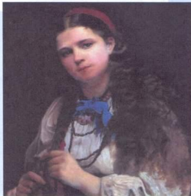
Девушка, заплетающая косу. Худ. А. И. Корзухин. 1883