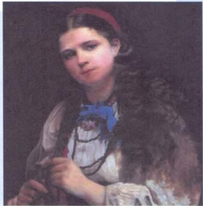
Девушка, заплетающая косу. Худ. А. И. Корзухин. 1883