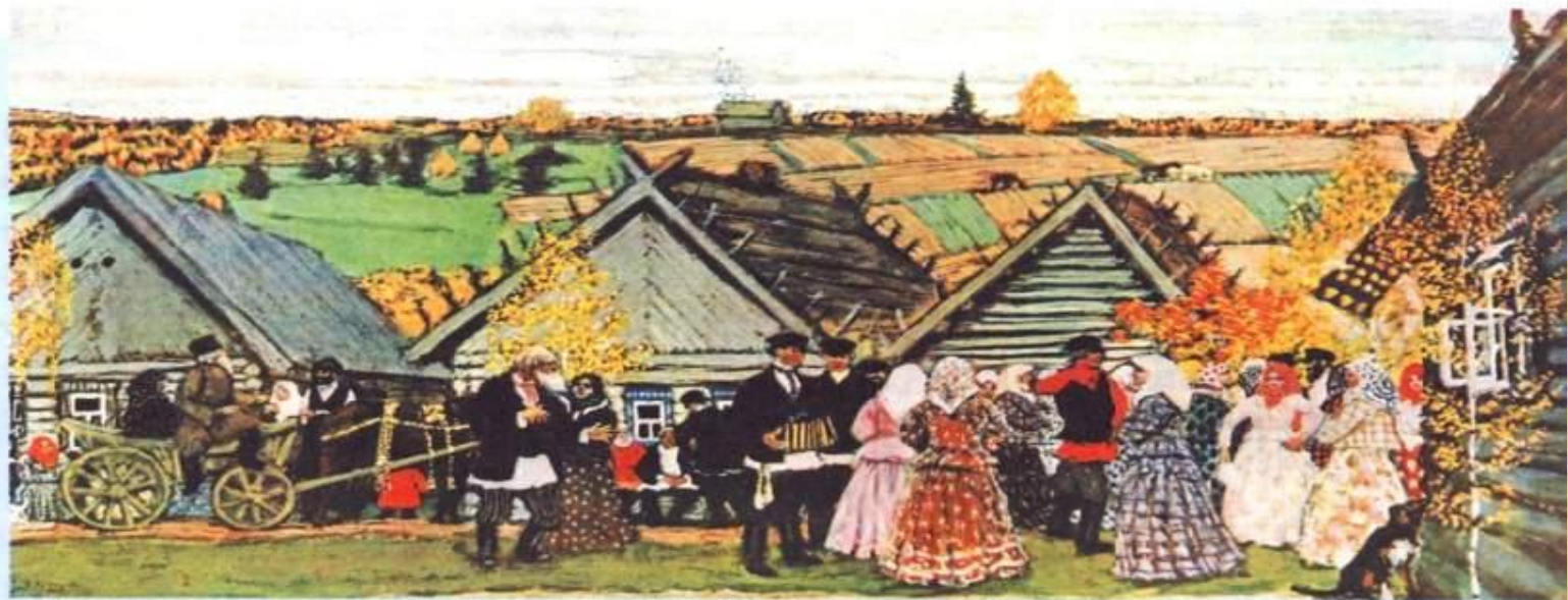
Праздник в деревне. Худ. Б. М. Кустодиев. 1907