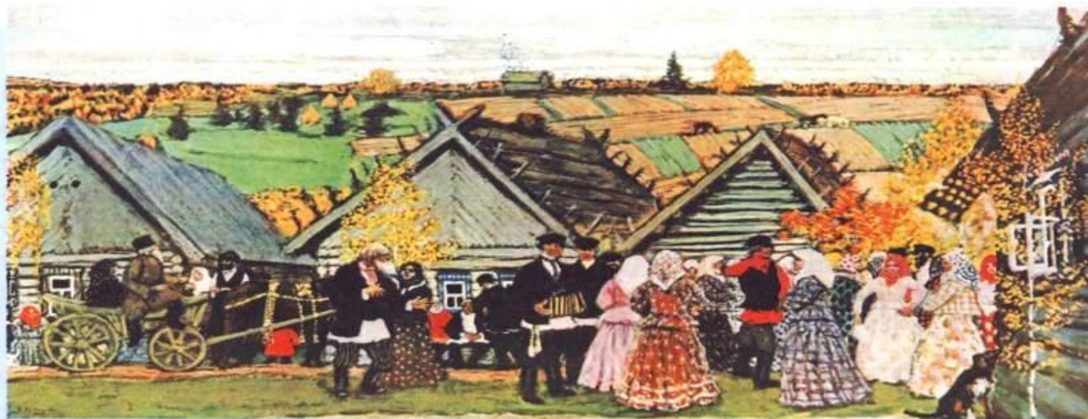
Праздник в деревне. Худ. Б. М. Кустодиев. 1907